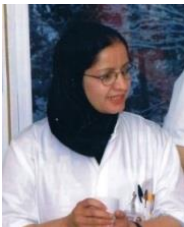
نوشته ای از دکتور خاتول فروتن

استفاده الكل به شكل مشروبات الكلی از زمانه های خیلی قدیم در اكثر نقاط جهان مروج بوده است. تاریخ نویسان در این مورد نظریات گوناگونی دارند اولین الكلی که مورد استفاده انسان قرار گرفته از انگورهای وحشی و یا توت ها و عسل تهیه می گردید که به اسم شهد آب یا Mead مسمی شده بود. استفاده این نوع الكل قدامت تاریخی زیادی داشته و در کشور های مثل هندوستان ، افریقای جنوبی ، چین و مصر مروج بوده است .