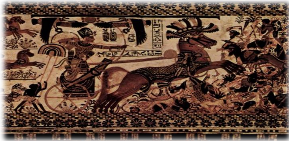
تصویر شکارچی مصری و استفاده چرخه ای ارابه دار بمقصد شکار

مصریها در خشکه با چرخه ای ارابه دار (گادی) و در آب بوسیله قایق دست به شکار می زدند. مصریهای کهن اکثرا توسط گرگدن دریائی با نیشتریکه در ریسمان ملحق بودند شکار مینمودند. اطفال با تویهای چرمی و بازیچه های چوبی و استخوانهای که دارای رنگ عاج بودند سرگرمی و ساعت تیری مینمودند. آنها تمایل داشتند که برزمنند و بوسیله شمشیرهای باستانی شمشیربازی کنند.