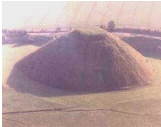
زمینداران از مالداران جدا گردیدند

کشف کشاورزی و مالداری، طبق نظر علما آینده ای بشریت را تعیین و مشخص نمود. ازین به بعد یک دورنمای پیشگی و بی نظیر برای افزایش غذا در زندگی انسان بوجود آمد. کشاورزی یک مقدار ضروری محصولات تولیدی را تأمین مینمود. مالداری نه تنها منبع گوشت، پوست و چربی (روغن) بود، بلکه بعد ها انسان دوشیدن احشام و محصولات شیری را آموخت. از احشام همچنان در هنگام خیش زنی، انتقال بار و سواری استفاده میگردد. فورمهای جدید اقتصادی زمینه را برای زندگی اسکانی مهیا نمود که در نتیجه آن دهکدهها با خانه های مستحکم و ساختمانهای مزرعی بوجود آمد.