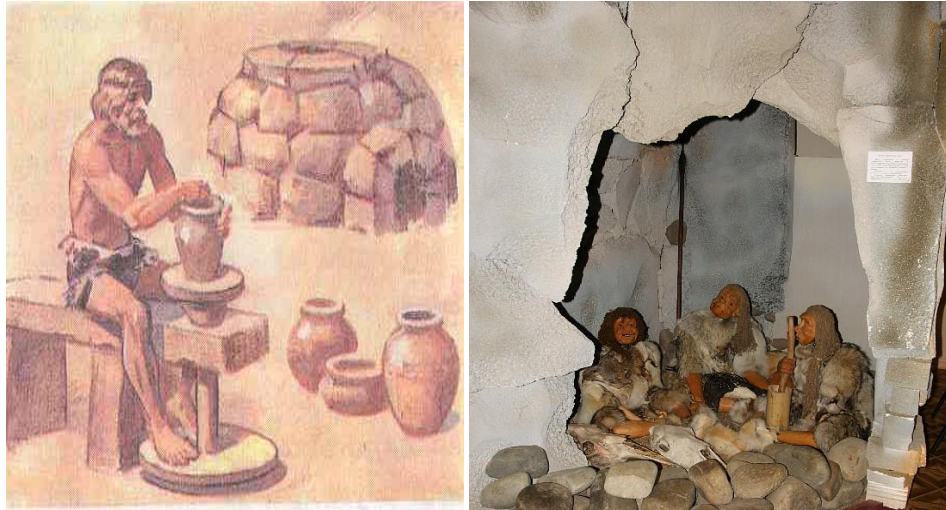
تصاویری از زنده گی انسان باستان و افزار کار در عصر نو سنگی