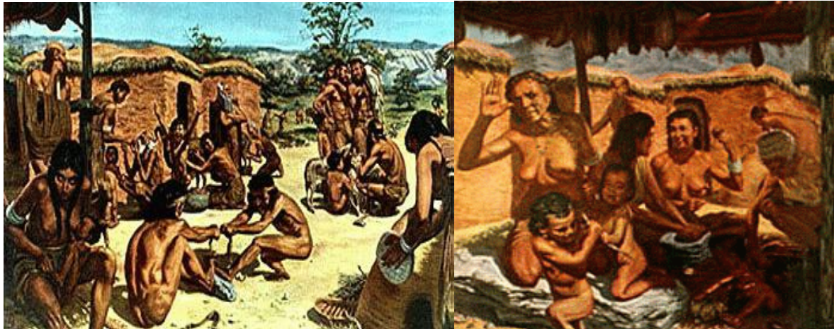
تصاویری از زنده گی کشاورزان مسکن گزین شده

پس، در عصر نو سنگی، انسانهای اولیه بتدریج از فراهم آوری (زندگی جمعی) و شکار به مزرعه و مالداري گزار نمودند. همین گزار را باستان شناس انگلیسی گوردون چایلد سالهای (1892-1957) " انقلاب نو سنگی " نامیده است. کشاورزی در زمینهای با شرائیطهای نسبتاً مساعد مروج گردید: اقلیم گرم و خاک حاصلخیز. چنین زمینها بنام " هلال حاصلخیز " مسما گردیده بود. در آن نخود، گندم سیاه و گندم میکاشتند. در سواحل دریایی (رود زرد) ، درچین هفت هزار سال قبل به کاشتن ارزن و لوبیا سویا آغاز کرده بودند. در قارهء امریکا پنج هزار سال قبل زرع نمودن جواری، کدو، حبوبات و پنبه را آموخته بودند.