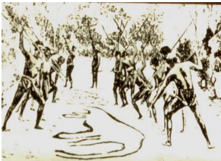
شکارچیان حین ضربه زدن تصویر جانور وحشی

فالگران (روحانیون) قبل از شکار تصاویر جانوران وحشی را در دیوار های مغاره ترسیم می نمودند و این تصاویر را با سر نیزه به کو بیدن می گرفتند. گویا، توسط این عمل شان، روح این جانور را "کشته اند" و فکر میکردند که میتوانند جسد او را در روز شکار به بسیار سهولت از پا در آورد.