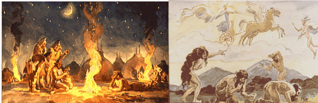
تصاویر بالا بیانگر ترس و بیم انسانها از پدیده های طبیعی

در افغانستان نیز هم زمان با این دوران، گروه انسان‌های پراکنده، در کنارهای چشمه سارها و رودخانه‌ها و دشت‌های متعدد و جنگل‌های گسترده و نیم گسترده و غارها و شکاف کوه‌های آن، سازمان ابتدایی زندگی خود را بنیان نهادند و از طریق گردآوری میوه‌ها، دانه‌ها و ریشه‌های گیاهی و شکارجانوران و صید ماهی، با استفاده از ابزار سنگی و شاید چوبی یا استخوانی امرار معاش می‌کردند.