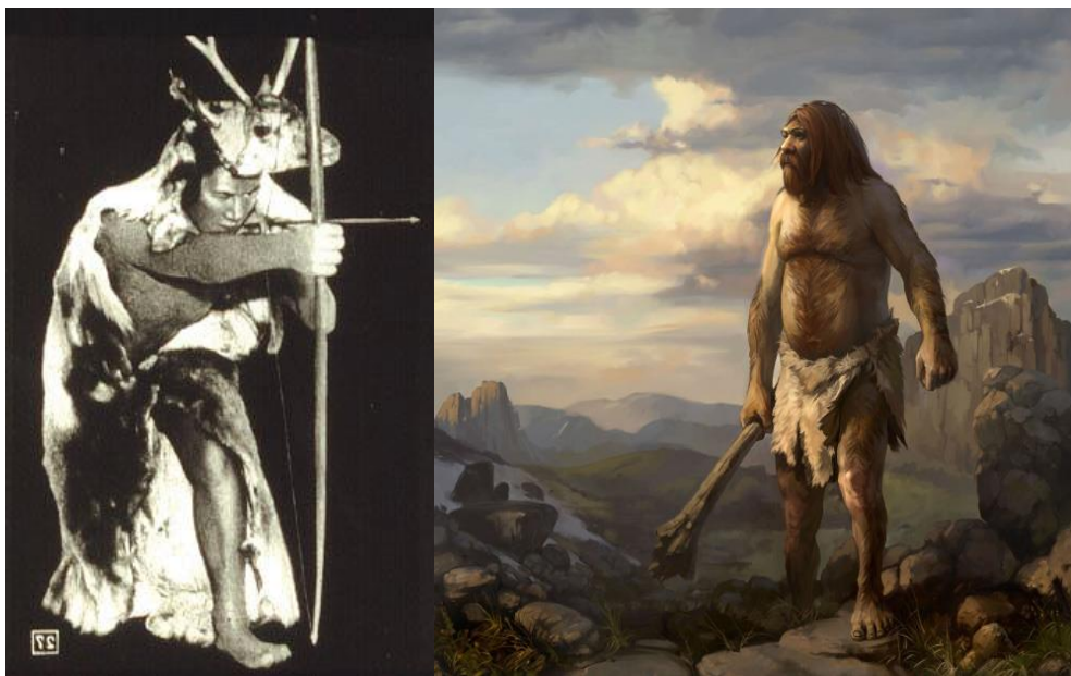
نمونه ای از لباسهای پوستی انسان مغاره نشین

نخست از همه، انسانهای مغاره دوختن را آموختند، آنها لباس میساختند، پوستها را بوسیله ای سوزن استخوانی میدوختند، آنها گاهی اوقات لباسهای شانرا از مهره ها و دانه های که از سنگهای رنگه و یا صدف که سوراخی در وسط داشت، تزئین می نمودند. آنها گردنبندها و دستانه هائی که از دندانهای حیوانات، استخوانهای فیل و سنگها ساخته شده بود با خویش حمل مینمودند. در آنزمان، اولین طراحان و تنظیم کنندگان مود و پیشن بوجود آمدند.