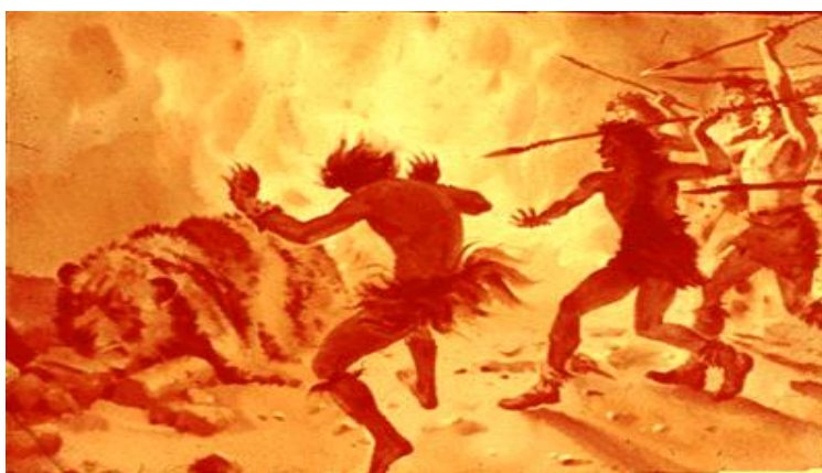
در تصویر بالا دو عمل انسان متجسم گردیده است: بی رحمی و دلسوزی

شکارچیان و فراهم آورندگان از خویش و از طبیعت مواظبت مینمودند، اما ایشان بطور دائم درست درک نمی نمودند که در جهان ماحول ما چه اتفاق می افتد. شکارچی توسط همان (عین) نیزه چندین بار، جانور وحشی را به قتل میرساند و بالاخره به فکر کردن شروع نمود و متوجه شد که نیزه " سعادت " است و در جوهر نیزه قوت و نیروی نیکو (مهربان) نهفته است. همین خاصیت های غیر عادی و افسونگر را به هر شیء عادی نسبت میداد. چنین اشیاء را مقدس می نامید. حتی نباتات «مقدس» شمرده میشد. مثلاً، درخت بسیار بلند و قوی میتوانست مقدس و «حمایه گر» اجتماع قبیلوی منسوب گردد. فکر مینمودند که روح این درخت انسانها را کمک می نماید.