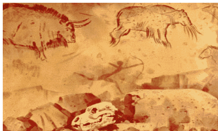
تصویری از جانوران مقدس

گاهی اوقات، در پهلوی منازل برش درشت از سنگ و یا چوب تصویر جانور مقدس ایجاد و گذاشته میشد. و شکارچیان جامعه اولیه، تصویر آن جانور را که قبيله اش بنام او یاد میگردد در وجود خویش حمل می نمودند .