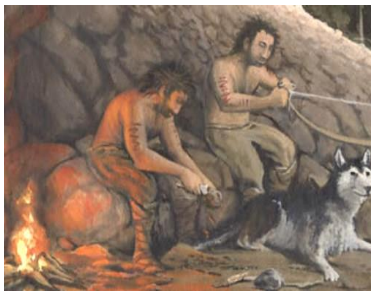
تصویر انسانهای باستان و سگ اهلی شده

بالاخره، تجربه هزارساله و دانستنی های تعمیم یافته در مورد جهان ماحول راه خروج از حالت پیچیده را پیش گوئی نمود. انسان اولیه نه تنها از طبیعت بهره برداری نمود، بلکه ثروت های آنرا دوباره احیاء و استقرار بخشید. انسانهای اولیه از بسیار سابق متوجه شدند که دانه نباتات که در زمین سست و نرم ریخته بود، بعد ها دوباره میروئید. همچنان ایشان درک نمودند که حیوانات کوچک یافت شده را در جریان شکار نبائست به قتل رسانید. انسانها بطورآگاهانه به کاشتن گندم، اهلی کردن حیوانات آغاز نمودند. در عصر میانه سنگی سگ را اهلی ساختند. سگ رفیق خوب و وفادار انسان در هنگام شکار و محافظ مطمئن مسکن بود.