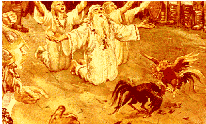
افسونگران (روحانیون) هندوستانی حین استدعا

انسانها درک آنرا نداشتند که چگونه بشریت در روی زمین بوجود آمده است. شکارچیان جامعه اولیه فرض مینمودند که اجداد و نیاکان آنها حیوانات بودند. هر طائیفه یک نوعی از جانور را بمثابة اجداد خویش محسوب می نمودند. زمانیکه شکارچی معاصر استرالیایی از طائیفه ای دینگو در صحرا (جلگه وسیع بی درخت) با این سگ وحشی رو برو شد او نمیتوانست به او ضرر برساند، مردها در هنگام جشنها ماسک دینگو را می پوشند و وجود شان را از رنگ پوست سگ رنگ آمیزی می نمایند و به رقص می پردازند و حرکات او را تقلید می کنند، و به سگ دینگو کلمه ای برادر خطاب می گردد .