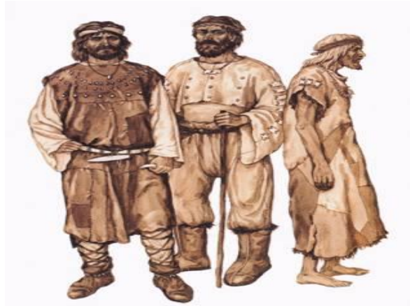
انواع لباسهای چرمی با الیمنتهای تکه ای در عصر نوسنگی