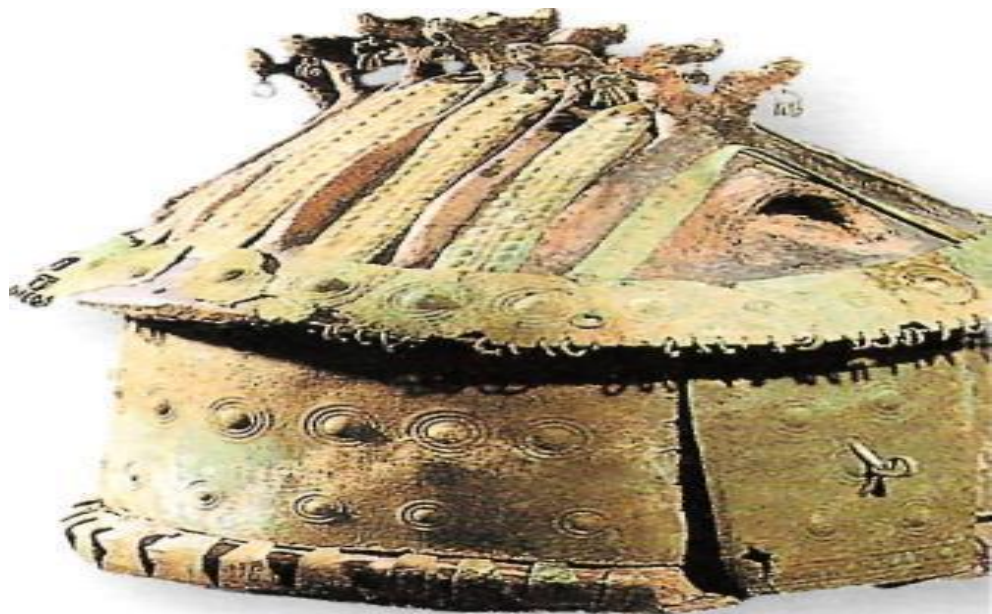
تصویر خانه باستانی اجاقدار

بعضی از گروههای شکارچیان مغاره نشین باستان در مسافت دورتر از مغاره، در دشتهای برهنه یخندان اروپای شرقی به شکار میپرداختند. آنها برای شان پناهگاهها میساختند. این پناهگاهها از پوست حیوانات درست میشد و مشابه به خیمه بود. شکارچیان این خیمه را در بالای چاه نیمه عمیق با دیوارهای پهن سنگی نصب میکردند، و از استخوانهای حیوانات و دندانهای تیز و دراز گراز بحیث پایه و ستون استفاده میکردند، در چنین پناهگاه، چند فامیل بودوباش داشتند، هر فامیل اجاق خود را داشت که از آن برای گرم ساختن منزل و پخته و پز غذا استفاده میکردند.