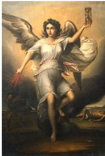
نمسیس دانتقام اودغچ اخیستو الهه یا رب النوع

ددی تولو یادونو څخه مونږ ته عبرت اودرس به څه وی؟ کله چی مونږ دمداخلی په مشق اوترین باندی پیل وکړ نو دسپینی مانی اداره نه یوایی داچی دامریکی خلکو ته دسوری دآزادی د اصلی ماهیت په اړین دخلکو څخه دمالیاتو دتولولو په اړه ددروغو حاله اووبدل بلکه د«سنی مدهبودچرخش» په اړه هم دامریکی خلکو ته ددرواغو یوه بله حاله هم جوړ کړل او هغه داچی له هغو څخه دانتقام اودغچ اخیستو موضوع دی . دلرغونی یونان په داستانونو اوقصو کی یوه داستان دسیاستوالو د تولگی دپاره ځانگری شوی دی او هغه داچی کله سیاستوالو په کوم گناه ککړیدل هغو ته داسی یو کلمه پکاروړل کیدل چی هغه کلمه عبارت له غرور او سرکشی څخه وه ،دغه غرور اوسرکشی یوډول طرز تفکروه چی دهغه سنتی دباور مندی اوداعتقاد پربنیاد ولاړ وه ، غرور او سرکشی په دی معنی چی ځنی انسانانو دخدایانو دآامرو څخه نافرمانی کول ، نو ددی خلکو د سرغړونو د مخنیوی دپاره یا داچی هغوته چی د مقدسا توپه وړاندی سرکشی کول الهه یا رب النوع ولیردول شو چی یو ددغه رب النوعو څخه نمسیس (Nemesis) دی .کوم چی دهغه معبد لاتراوسه په مکدونی کی داوالمپ د غردپاسه موجود دی ، نمسیس