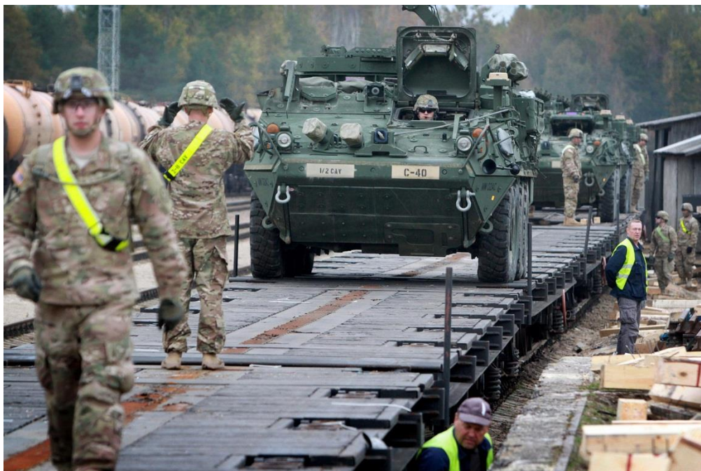
با آماده شدن لیتوانیا علیه راه برد جدید نظامی روسیه، ناتو تردد نشان میدهد

این از موارد گفت و گو هائی جاری در مسکو است. واضح نیست تا خاتمه یافته باشد. سلاح سنگین می تواند بطور ساده عبارت باشد از جستجوی کوچکی، یا که می تواند مقدمه ای برای یک حمله باشد. ما میدانیم که یک ازدیاد قابل ملاحظه ای در حضور روسیه در منطقه محاصره شده بمیان آمده است، اما تا کنون برای ما روشن نیست که روسها از لحاظ لوجستیکی برای یک حمله مهم آماده باشند.