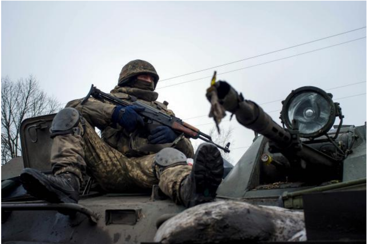
عسکر یوکرایی سوار روی یک عراده زرهی در نزدیکی دونسک به تاریخ 23 جنوری.