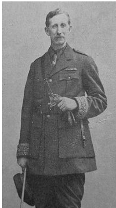
پیکو «از فرانسه»

منطقه تحت نفوذ فرانسه (آبی) - منطقه تحت نفوذ انگلیس (قرمز) و منطقه تحت نفوذ روسیه (سبز)