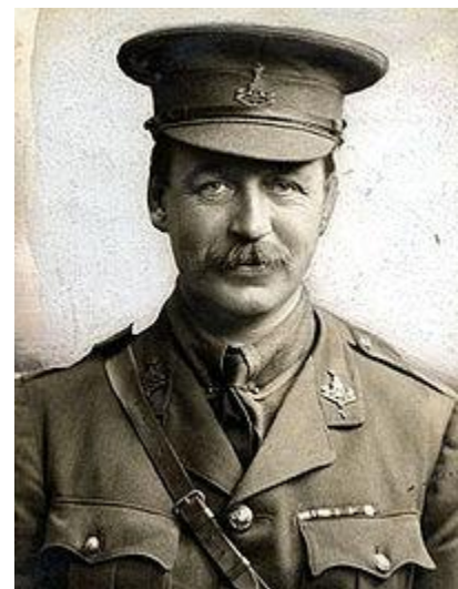
سایکس «از بریتانیا»