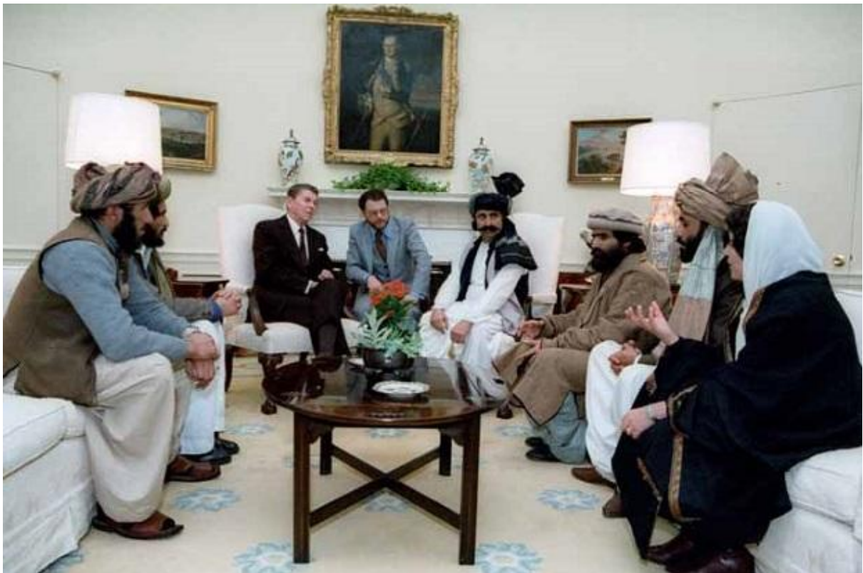
د امريكى جمهور ريس ريگن دافغان مجاهيدينو سره په سپينه مانى كى كال (۱۹۸۳)

د تیلو (نفت) پر زیرمو با ندى لاسرسى تر لاسه كړى په مينځنى ختيځ كى مداخله وكړ چى دهمدى مداخلى په نتيجه كى داسى يو منا سب چاپيريال د اسلامى بنياد گرايى د ودى د پاره را مينځته شو او دغه نوى اسلامى ډلى د امريكى دمتحده ايالاتو د گټى د تر لاسه كولو پر ضد عربى ناسيونالستى كركى په تدريجى بنى سره راوپاريدل په وده او په پرمختگ با ندى پيل كړ د امريكى دمتحده ايالاتو پر ضد دغه اقدام او كركه د عربى نړى په ټولو برخو كى خپل لمن و غورول كوم چى ددى ضد امريكاي قوتونو له مينځ څخه ځنى اسلامى افراطگرايى ډلى ټپلى د پوره خشونت داوصافو په لرلو سره خپل موجوديت د اسلامى دولت په بڼه سر راوچت كړ يعنى دغه اسلامى افراطى دولت وروسته له هغه چى د امريكى متحده ايالات پر عراق باند تجاوز وكړ او د همدى تيرى د اړو دورو په پايله كى دغه د عراق او د سوري تر نامه لاندى اسلامى افراطى دولت رامينځته شو چى مونږ ټولو اوس دهغه دولت كړنى پخپلو رڼو سترگو سره وينو .