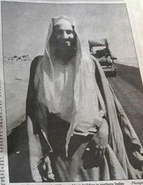
Osama Bin Laden surveys the 800km road he is building in northern Sudan.

Daily service to the USA ONLY ON THE WEEK AHEAD A lesson in the language Gatt set