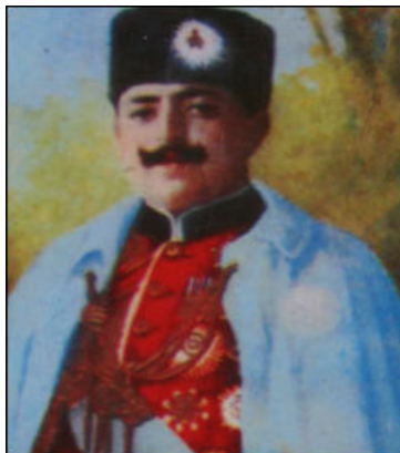
شاه امان الله غازی در لباس شاهانه

علامه حبیبی از مورخان نامدار افغانستان در قرن بیستم است و عادت نداشت، قلمش را در مدح و ثنای شاهان و امیران محمدزائی بکار اندازد، زیرا که پدر کلانش مولوی عبدالرحیم آخندزاده از کشته گان دست امیر عبدالرحمن خان بود، و خودش نیز از دست استبداد خاندان حکمران (نادرشاه) مجبور به فرار از کشور شده بود، و مدت ده سال در غربت و جلای وطن، با تنها قلمش برضد استبداد سلطنتی مبارزه میکرد. ازین جهت او با خاندان محمدزائی در افغانستان میانه خوبی نداشت، اما از آنجایی که مؤرخ و واقعیت بین و حقیقت پسندی بود، آنجا که نام شاه امان الله غازی در میان می‌آید، از تعریف و تمجید آن شاه غازی و رژیم مترقی امانی دریغ نمیکند، حتی کمر به جنگ برای اعاده سلطنت او می‌بندد و با لشکری که از مردم قندهار و ولایات همجوار آن برای اعاده سلطنتش آماده پیکار شده بود، اشتراک می‌ورزد.