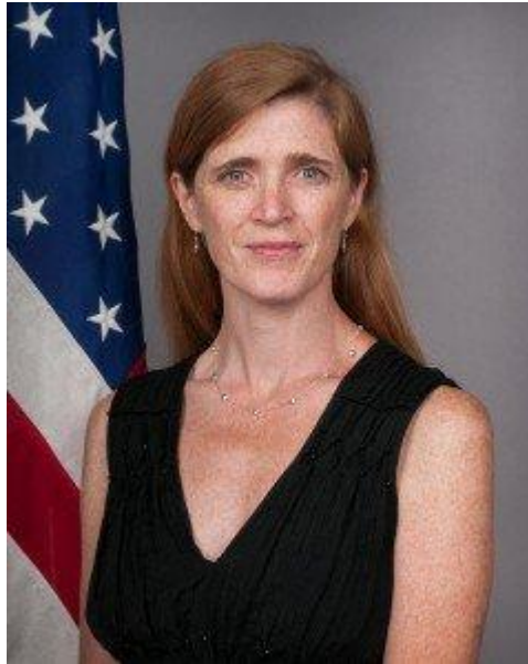
سام سامنتا پاور دامریکی سفیر

عاطفی اویو ناخاپه گذار دی چي د بله ایزه پروپاگندی ارگانونو د پاره د تبلیغاتی موادو برابرول دي .