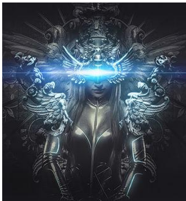
یک ولکر افسانوی

او یعنی هیلاری کلنتون تجاوز جورج دبلیو بوش را اذعان و تایید نمی نماید ( که او را باشور و حرارت تایید و خود را بطور کامل همچو ولکرها « زنان جوان و زیبای هستند نادیدنی که در جنگها به نبرد می پردازند » که جنایتی او را در معرض دید قرار دهد چونکه هیچکس او را متوجه اشتباه اش ن ساخت ) او همچنان از موضوع کردها و یا به ارتباط کردها اصلاً کدام تحلیل و ارزیابی منطقی ندارد ( او گاهی هم از سوی حاکمان آگاه امور سیاسی اش مورد سرزنش قرار نگرفته از اینکه عقل تنبل او بتواند در مورد جهان واقعی چیزی بداند ) .