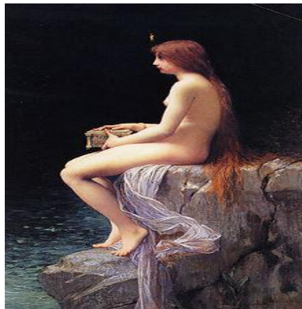
Pandora (Jules-Joseph Lefebvre, 1882)

پنج: تجاوز بالای عراق باعث بروز اختلاف و مبارزه بخاطر کسب قدرت در منطقه بین اسلامگرایان سنی از یک سو و دشمنان شیعه (دیگران) از سوی دیگر بویژه زمینه مسابقه را بین دولت های عربستان سعودی ( دولت عربستان سعودی در حمایت از اهل تسنن ، شیعه ها را بعنوان مرتد مینگرد و بیم از آن دارد که مبادا جمعیت اهل تشیعی که در تحت فشار دولت عربستان سعودی قرار دارند طغیان نه نمایند) و ایران فراهم آورد که ایران نیز تمایل دارد تا شیعیان رادرسوریه ، لبنان و یمن و جاهای دیگر در تحت چتر محافظت خود قرار دهد( به اصطلاح هلال شیعه ها از ایران به آسمان مناطق و ایالات تحت کنترل حزب الله در لبنان که در واقع در برگیرنده وجوه مشترک حرکات وژستها با ایران دارند نیز نمایان شد و نباید از یاد برد که این همه موارد توسط رژیم قرون وسطی در ریاض مورد هدف قرار گرفته است ریاضی که همه ای از این موارد راناشی از ترس با قلم ایران رنگ و پردازداس مینماید ) سعودی ها مشتاق آن اند که باید ایالات متحده امریکا در تحت بها نه ای تهدید هسته ای ایران - بالای ایران تجا و ز نماید ، سعودی های که پیشینیان جبهه النصر در سوریه اند و در عین زمان دولت افراطی اسلامی عراق و سوریه (ISIS) را نیز با شماری از نیروهای اسلامی افراطی که در مقابل رژیم علوی سوریه در جنگ وستیز اند کمک مالی و بودجوی می نماید . و از جانبی با کمک و همدستی مستقیم ایالات متحده امریکا و بریتانیا در روز روشن به بها نه دروغین که شورشیان ( شیعه حوثی) از عوامل ایران اند بالای مواضع آنها در یمن بمباری مینماید این رویدادها