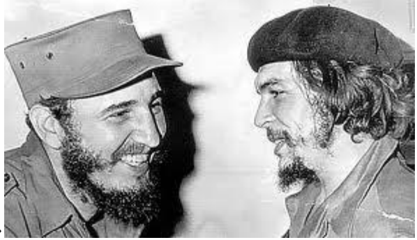
« فیدل آخاندرو کاسترو روث » :

وی در 13 اگست 1926 در شهر بیران متولد شد . او زمانی که دانشجو بود ، در یک گروه دانشجو پیوست که ضد فساد سیاسی مبارزه می کرد . کاسترو در سال 1947 عضو حزب مردم کیوبا شد و به جناح چپ این حزب داوطلب مبارزه مسلحانه علیه نظام رافائل تروخیودر جمهوری دومینیکن شد . مرحله بعدی جنبش رهایی بخش خلق کیوبا جنبش 26 جولای 1953 بود که توسط فیدل کاسترو ایجاد شد . آغاز عملیات انقلابی به رهبری فیدل در 26 جولای حمله در یک پایگاه نظامی در سانتیاگوی کیوبا بود که با زدو خورد مسلحانه عده ای از یاران کاسترو جان باختند و کاسترو و باقی یاران شان باز داشت و زندانی شدند .