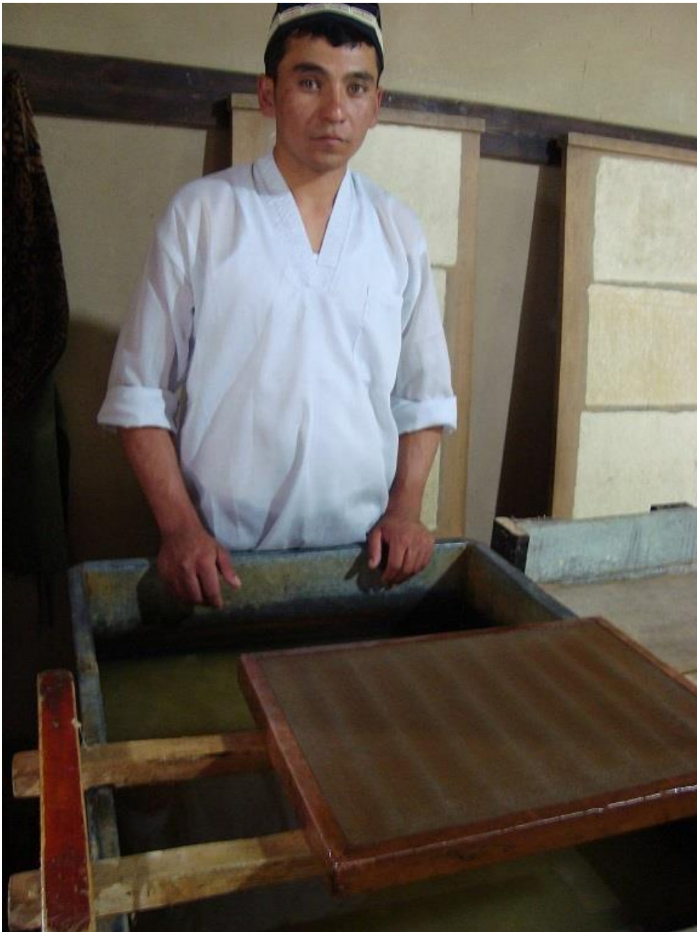
از دستگاه های تهیه کاغذ