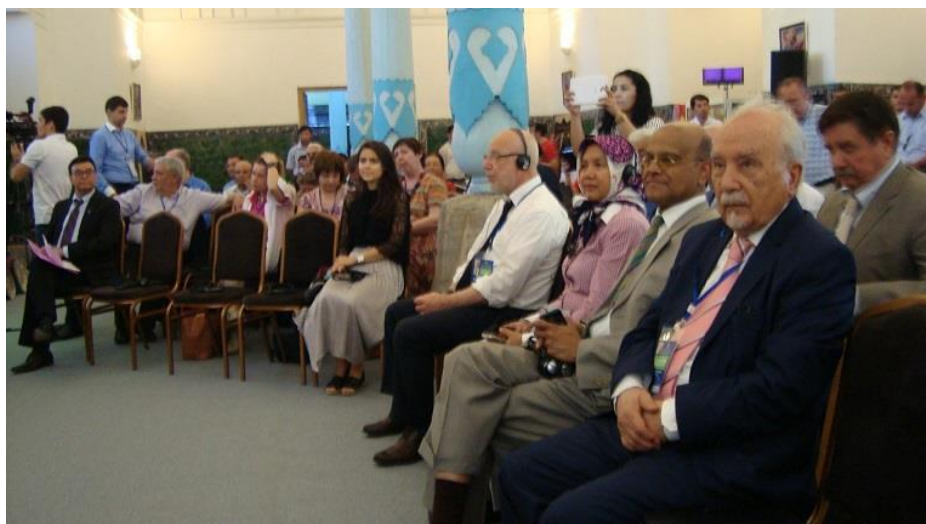
جریان کنفرانس در سگشن اول