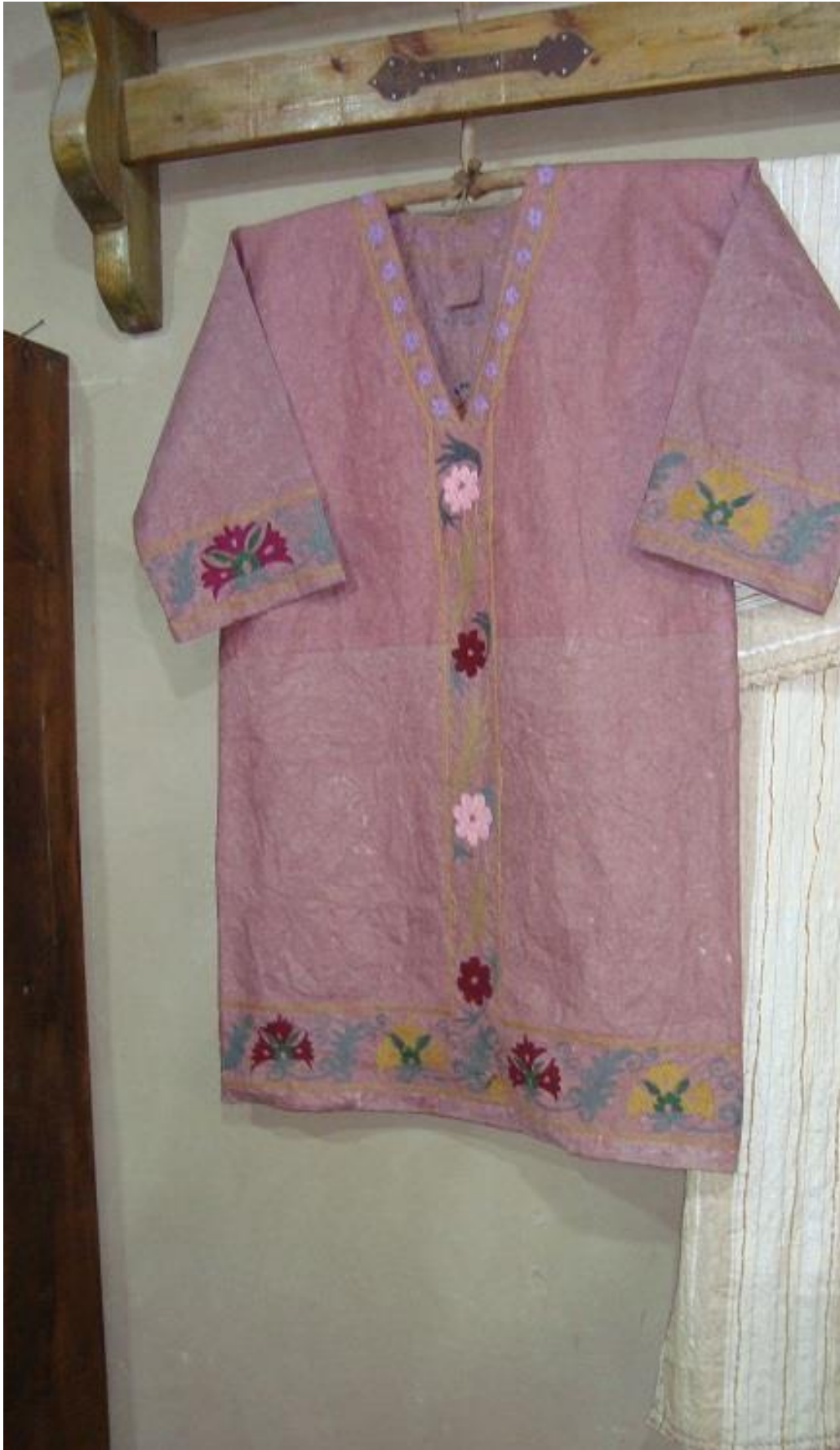
نمونه لباسهایی که از کاغذ سمرقند ساخته میشود.