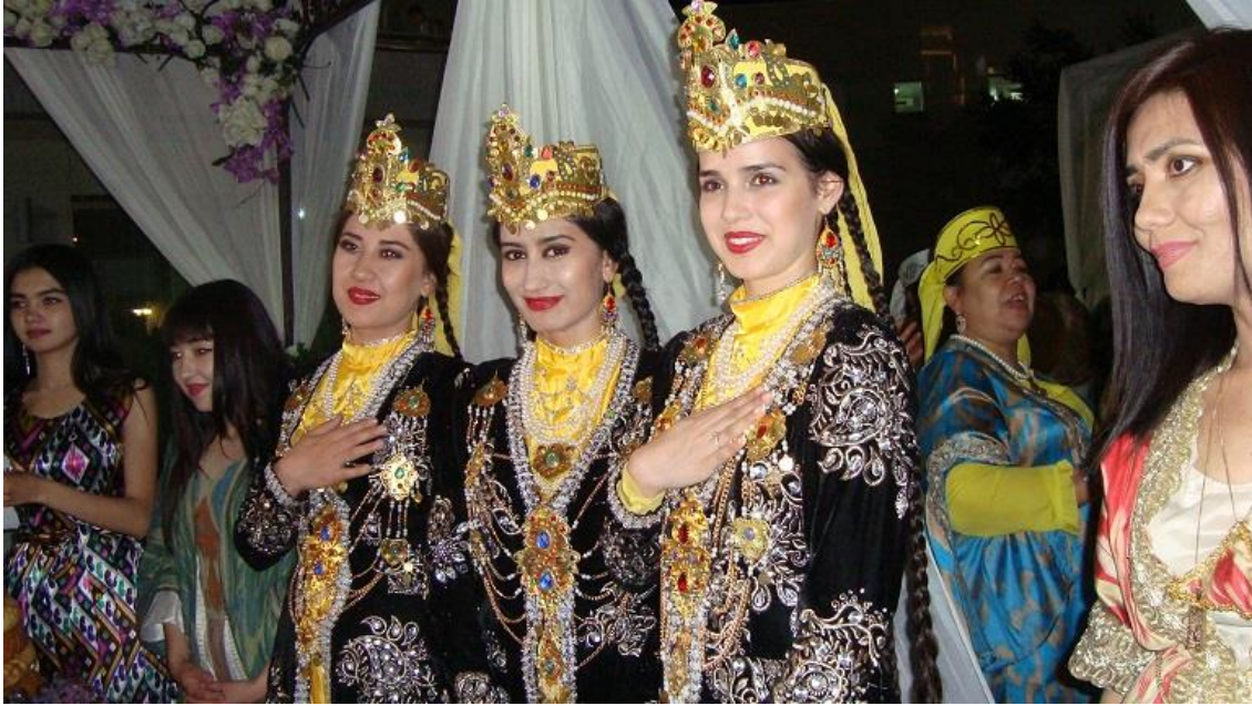
پذیرایی از مهمانان