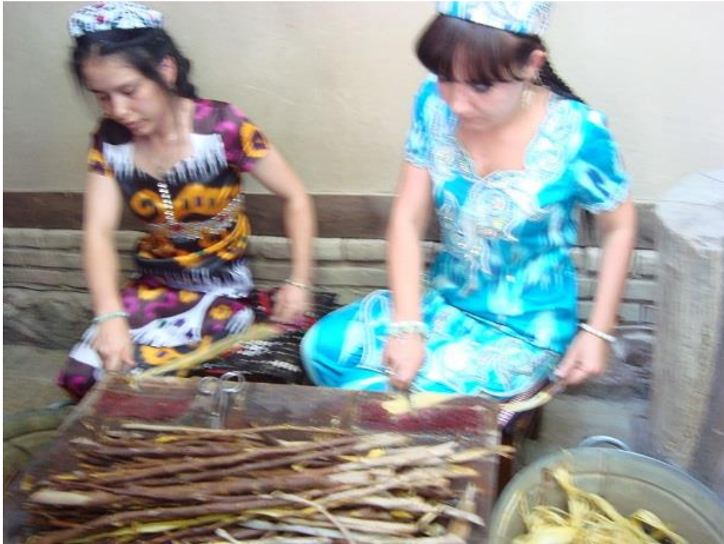
تهیه مواد خام کاغذ از پوست شاخه های درخت توت.