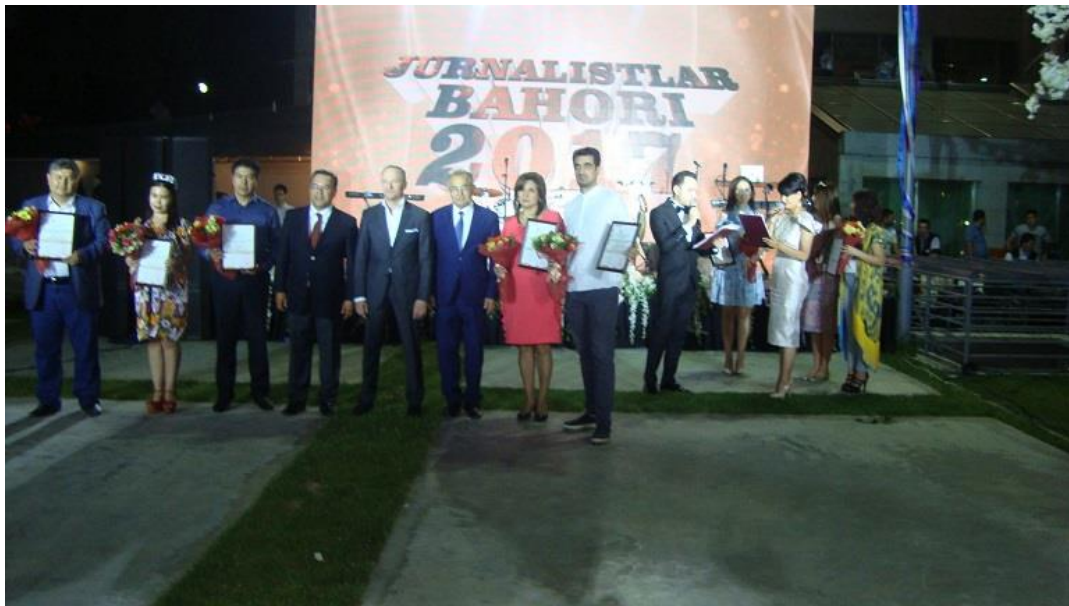
برنامه بهار ژورنالیستان