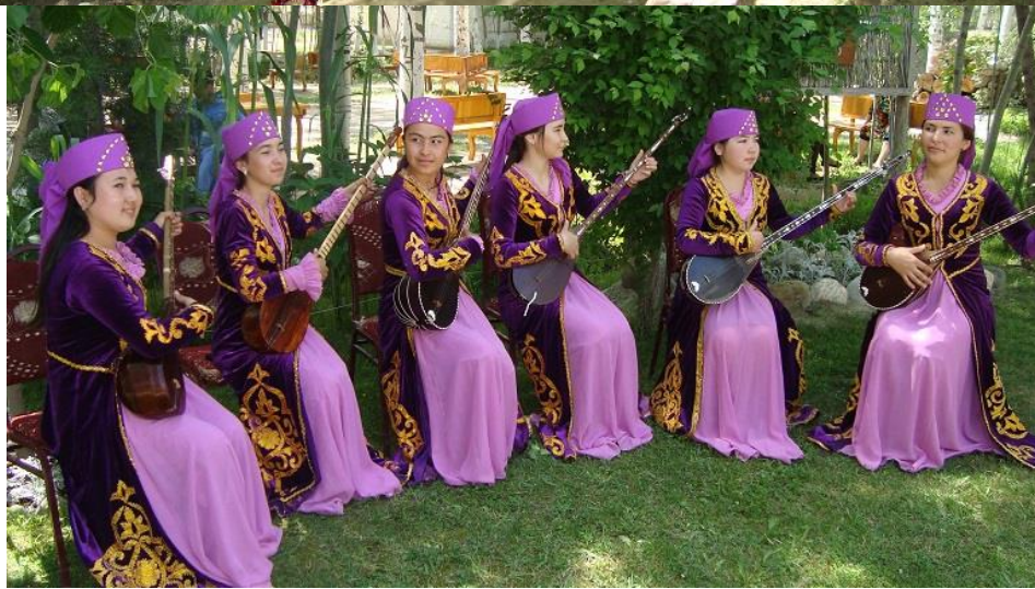
گروه دختران دوتار نواز