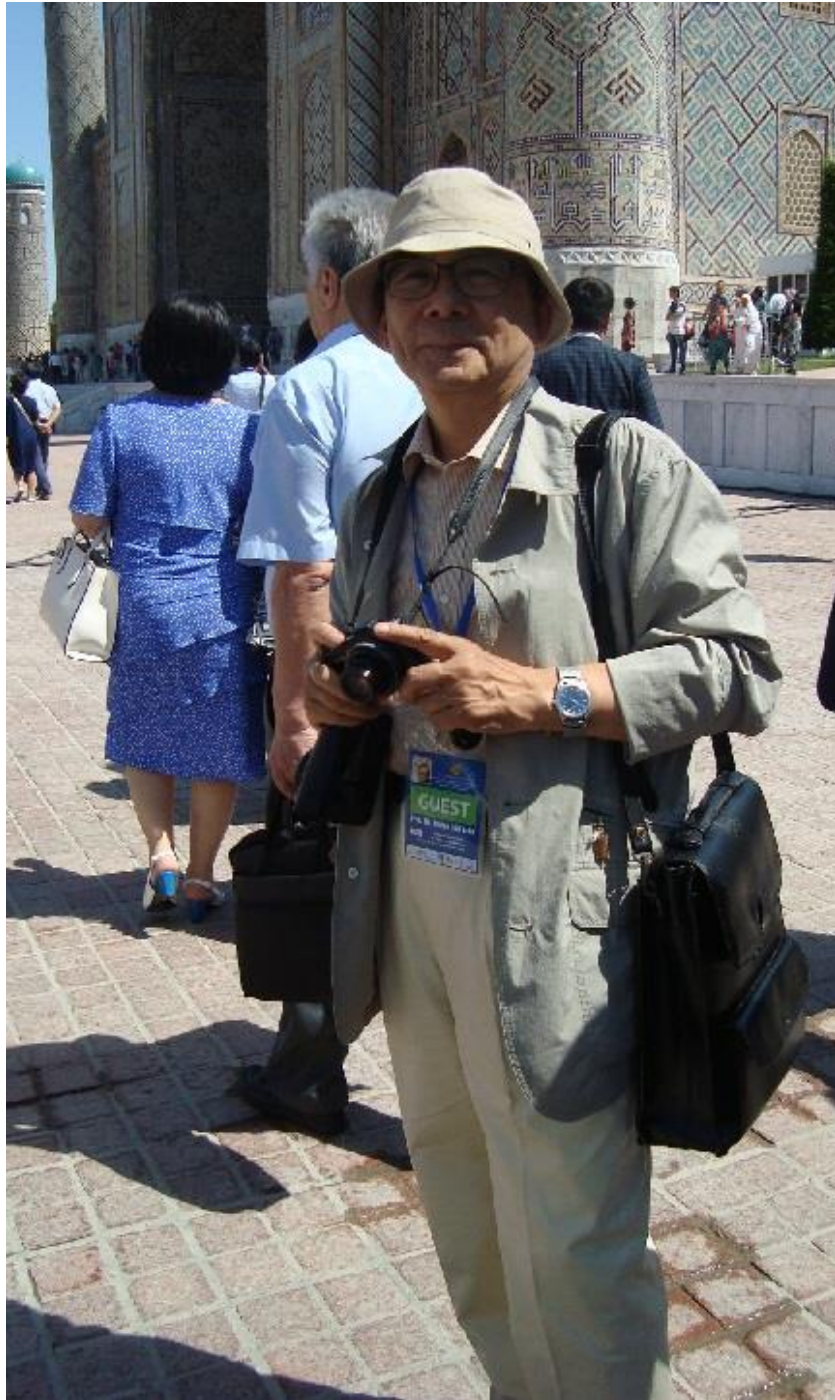
دانشمند بابرشناس جاپانی دوکتور تسوگی گینیچی در میدان.