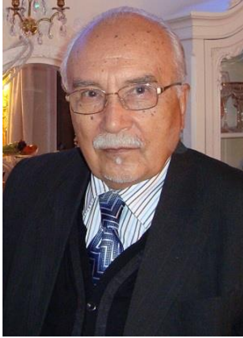
پروفیسور شرعی جوزجانی