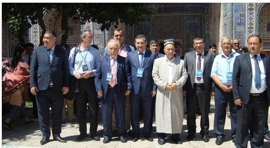
با رئیس دانشگاه اسلامی تاشکینت پروفیسور روشن عبدالله یف و دانشمندان دیگر.