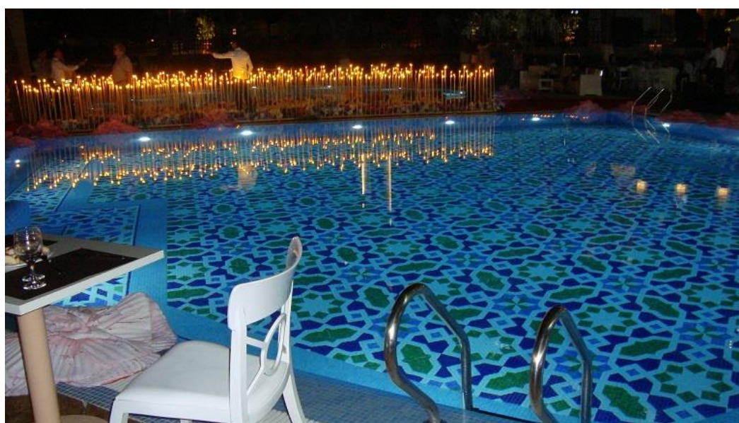
انعکاس نور چراغها در آب شفاف برکه های فواره