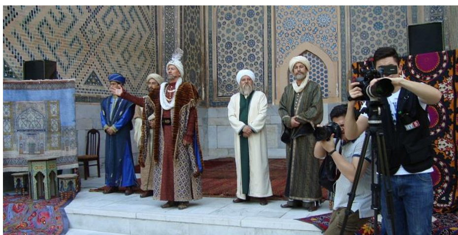
تمثیل حضور میرزا اولوغ بیک با شاگردان و همکاران علمیش در مدرسه.