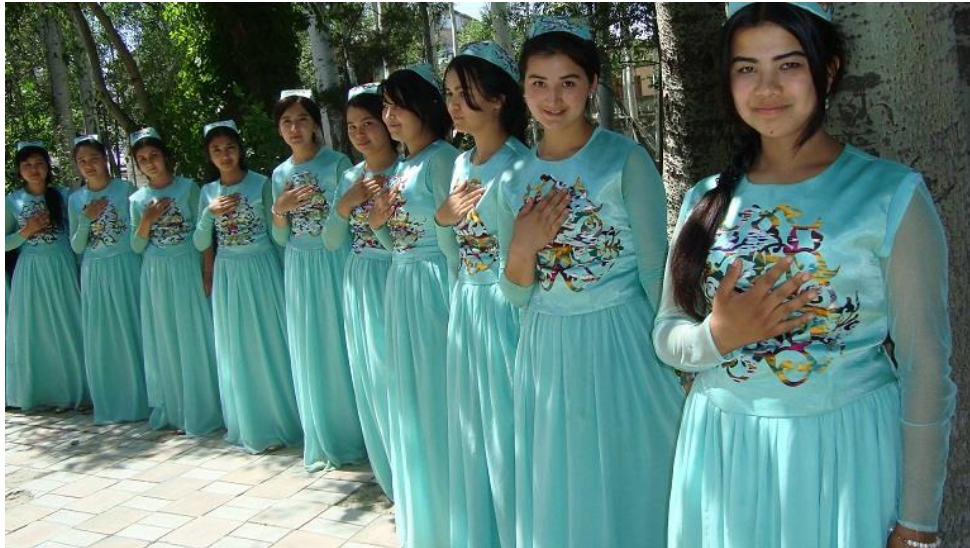
استقبال از مهمانان