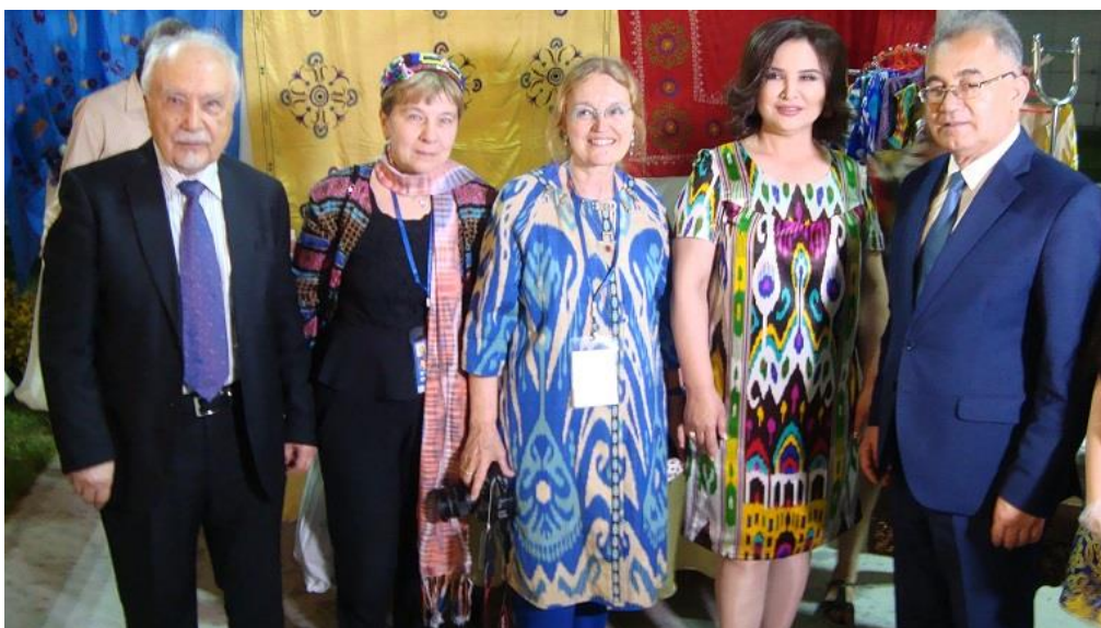
با پروفیسور اکمل سعیدوف، سراینده مشهور زلیخا بایخانوا، ب.ب. فدريکو مؤسس انجمن هنر و تاريخ تیموریان و سر دبیر مجله تیموریان در پاریس و یک دانشمند اروپایی.