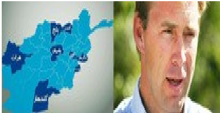
آخرین توطیه بریتانیا

پیشنهاد مؤرخ ۱۰ سپتامبر ۲۰۱۲م عضو محافظ کار پارلمان و معاون وزیر خارجه بریتانیا به ارتباط تجزیه افغانستان عزیز به هشت قسمت