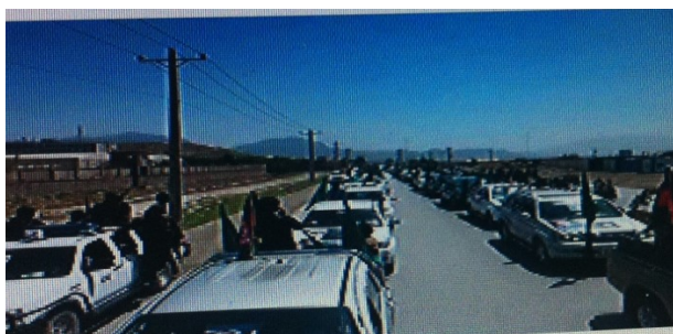
ورود رئیس سی-آی-ای به کابل