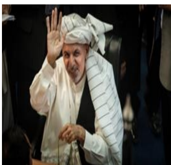
اشرف غنی رئیس جمهور