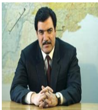
نجیب الله رئیس جمهور