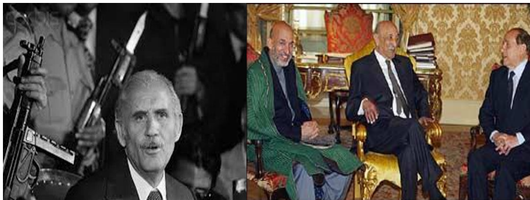
نورمحمد ترکی رئیس شورای انقلابی

بنأ ظاهر شاه ، تره کی ، حفیظ الله امین ، نجیب ، خلیل زاد ، کرزی ، گلبدین ، ملاعمر ، اشرف غنی ... وده ها رهبران دیگر پشتونها چه اندیشه های چپی دارند یا راستی ، دیندار هستند ویا بی دین هیچگاه راه وروش همبستگی تباری ایشان را چیزی سد واقع نمی شود . همیشه براساس خود شناسی وخود سالاری قومی دروابستگی به نهاد های سرمایه ، جهت استقرارحاکمیت سیاسی پشتونها در افغانستان یکسان عمل کرده ومی نمایند.