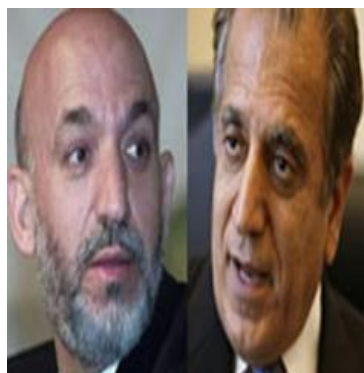
خلیلزاد سفیر آمریکا در کابل