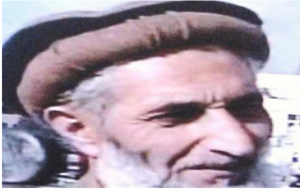
استاد عبدالصبور فرید صدراعظم افغانستان