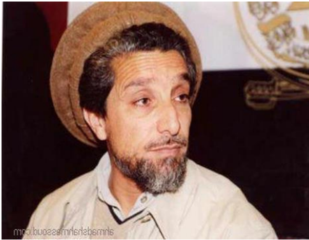
احمدشاه مسعود وزیر دفاع و سردار مقاومت

گلبدین حکمتیار سوای آنکه پُست صدارت تحت رهبری حزب اسلامی قرار داشت. مگر با درد و تأسف باید گفت که این فرد وابسته به پاکستان و نهاد های سرمایه و دشمن مردم بومی این سرزمین ، گستاخانه در چهار آسیاب استان لوگر مقابل دولت ربانی سنگر گرفت . و به پشتیبانی پاکستان هر روزه ده ها و حتا صدها خمپاره را از آنجا به کابل پرتاب می کرد. و این عمل ناجایز وی سبب کشته شدن هزاران شهروندان کابل گردید.