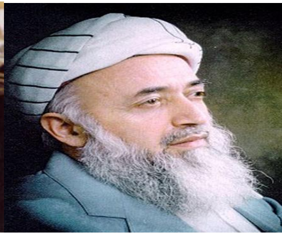
برهان الدین ربانی رئیس جمهور افغانستان

گلبدین حکمتیار از پایه ، دولت جمهوری اسلامی افغانستان بر رهبری تاجیکان را قبول نداشت . و آرزو و امید رهبری دولت را به سر می پروراند .