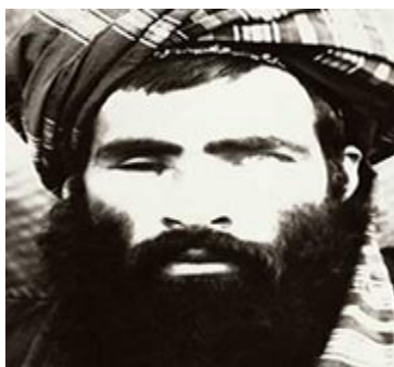
ملا عمر رئیس جمهور در زمان طالبان