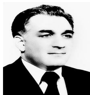
حفیظ الله امین نخست وزیر