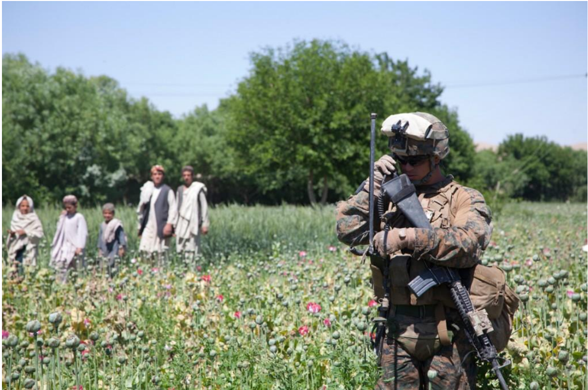
دمتده ایالاتو دسمندری ځواک دمشر نیورودریگیوس (Neo Todrigues) دالفا دلمری بتلیون داومی سمندری ځواک دشیپرم تیم رزمی اوجنگی سرتیری دهلمند دسنگین په اولسوالی کی دمی دلمری نیټی کال (۲۰۱۲) کی دگزمی وهلو په حال اودځای خلکو سره دامنیت دتامین دپاره اریکی نیول.