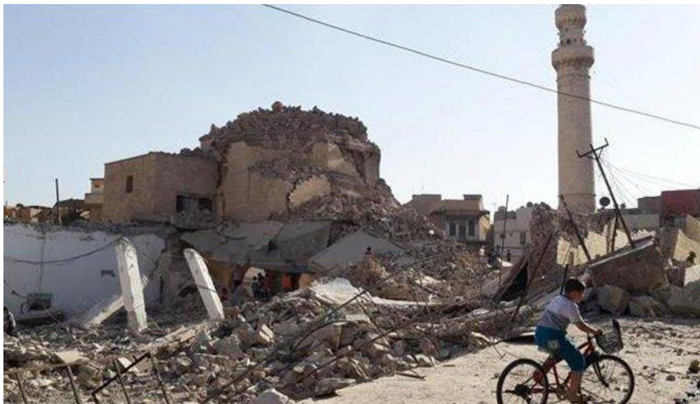
دوچرخه سوار در جلو مسجد جامع قدیمی مخروبه‌هاز پیامبر جریس در مرکز موصل در تاریخ (27) جولای (2014)

تا آواخر سال (2011) بیش از (650000) نفر عراقی زندگی خود را از دست دادند که بصورت مقایسوی میتوان گفت که در جنگ دوم جهانی تعداد کشته شده ها در حدود (450000) نفر از نیروهای بریتانیا و غیر نظامیان بود که زندگی خود را از دست دادند