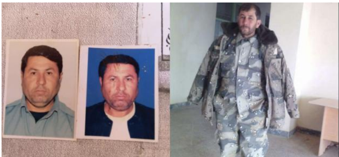
مراد په کین اړخ او خواجه په بڼې اړخ آخوړونو کې دی کوم چې د جګړې په وخت کې خپل ژوند د لاسه ورکړل

0,1 : د طالبانو جنګیالیو د دشت قلعه یعنی د سیند په سهیلی کې چې افغانستان له تاجکستان څخه بیلوی په سرحدی سیمه کې د سرحدی پولیسو پر پوستې باندې د شپې په وروستیو وخت کې برید ترسره کړل پولیسو د چشمه ایخانم ( Chashme e Aykhanam) ته نژدې د قوما ندې پوستې ته عقب نشینی و کړل او د څو ساعتونو دپاره دخپل د لاسه تللی موضع دبیرته تر لاسه کولو دپاره پیر هڅې و اوند وکړ کوم چې ددی جګړې په وخت کې دوه پولیسانو خپل ژوند د لاسه ورکړل او دوه نور یې تپیان شول ، شورشیا نو د پولیسو دوه همبې (Humvee) موټر او یو څه نور مهمات او تجهیزات د غنیمت په بڼه تر لاسه کړل او د یو خبری منبع په قول سره کوم چې هغه چندان د سیمې سره آشنا نه وه وویل چې شورشیا نو د ځان سره پنځه نفر نور برمه و یورل .