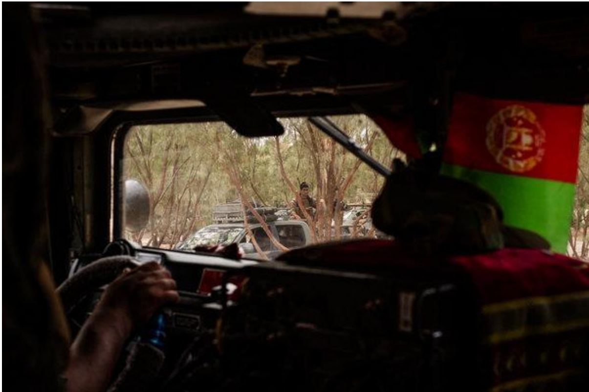
یکی از اعضای ستیزه جوی 02 در ولسوالی باتی کوت ولایت ننگرهار»، کاندیدای جیم هیلبروک برای نیویورک تایمز»