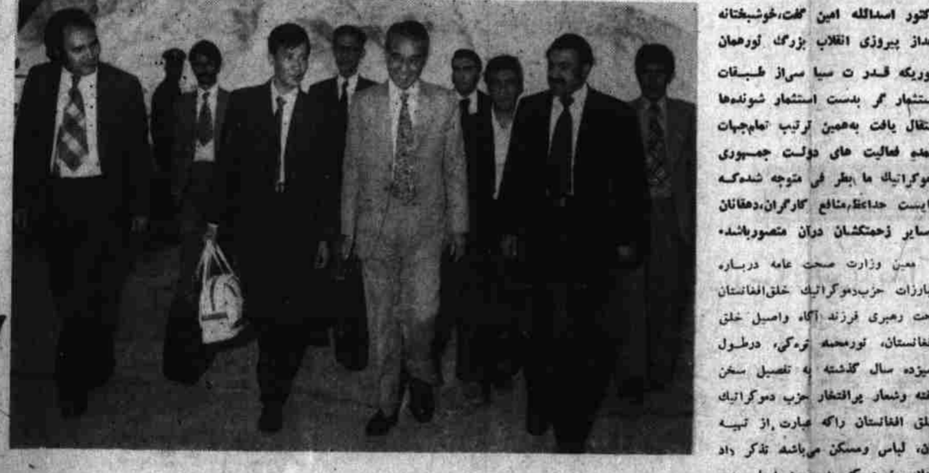
هیات تجاری جمهوری سوسیالیستی ویتنام هنگام ورود به میدان هوایی بین المللی کابل