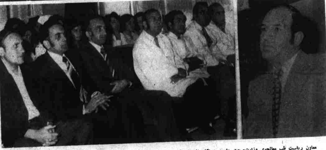
معاون ریاست طب معالجوی وزارت صحت عامه هنگام افتتاح کورس انستیزی در موسسه صحت طفل

مساعدت هموطنان نوع دوست ما بموسسه افغانی سره میاشت