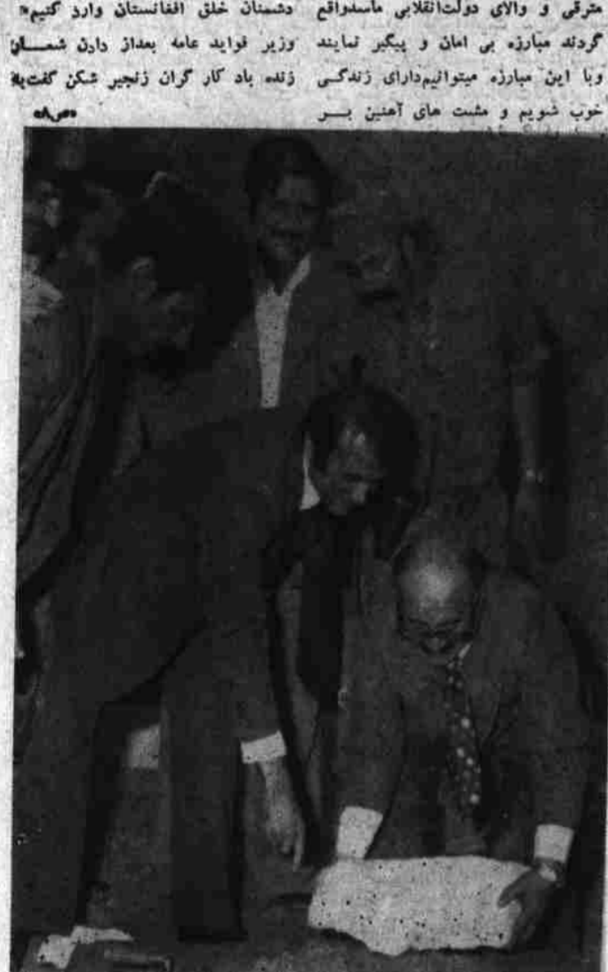
دستگیر پنجشیری وزیر فواید عامه هنگام گذاشتن سنگ تهداب عمارت اداری دستگاه ساختمانی بنایی