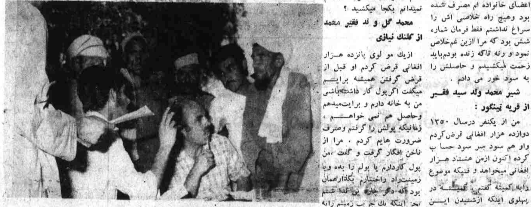
کمیته حل مشکلات از داستان هم انگیز این شخص انگشت به دستان مانده اند.

چون من کدام زمین و یاغی جیزی نداشتیم که این برادر سود خورم مگرم اعتبار میکرد و ازینکه با دارم صاحب جاه و جلال بود او را نسبت به من ترجیح دادگرچه من غدرورازی کردم ولی تأییری بالای او نکرد اما خودش بر ضای خود پول را به با دارم داد که او همین پول را در حقیقت برای من گرفت و من هم این پول را قلبه گاو خریدم حالا شما بگوید که من قرضدارش هستم یا با دارم. بنام این ادعایش بخاطر چون من کدام زمین و یاغی جیزی نداشتیم که این برادر سود خورم مگرم اعتبار میکرد و ازینکه با دارم صاحب جاه و جلال بود او را نسبت به من ترجیح دادگرچه من غدرورازی کردم ولی تأییری بالای او نکرد اما خودش بر ضای خود پول را به با دارم داد که او همین پول را در حقیقت برای من گرفت و من هم این پول را قلبه گاو خریدم حالا شما بگوید که من قرضدارش هستم یا با دارم.