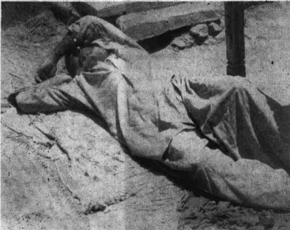
یک تن از زندانیان محبس ننگرهار که بازرگرسنگی و بی اتافی با حالت ضعف بر سر بوریایی در صحن زندان خوابیده است

محبوسین به حیث یک معیار کلی قبول گردیده است. در حقیقت حبس و زندان بیش از همه بمنظور تجرید وقت شخص مجرم از محیط و آنهم بواسطه تربیت و اصلاح منش و بازگشت مجدد و بعنوان یک فرد مطمئن و هوطن سودمند است. اساساً در نظام های دموکراتیک هدف از حبس، تعذیب انسان و یافتن سوال - قرار معلوم هیات موظف دولت جمهوری دموکراتیک افغانستان در مدت کمتر از یکماه هشت هزار دوسیه ملتوی دیوان جزای تمیز را کسه بالغ به بیش از دو میلیون ورق میشد حل و فصل نموده و فیصله نهایی در باره آنها صادر کرد. قانونیت فیصله ها صورت گیرد. سوال - اینکه در مدت کمتر از یکماه هشت هزار دوسیه که بیش از دو میلیون ورق بود حل و فصل گردید این سرعت عمل در بررسی دقیق دوسیه ها تا تیر متفی بجا نمی گذارد؟ جواب - با توضیح بالا یقین دارم فیصله های صادره کمیتهای (شانزده) گانه با