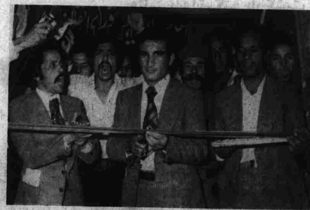
معین وزارت صحت عامه هنگام افتتاح پروژه آب مشروب صحرای چهلستون (عکاسی باغین)

پروژه آب مشروب صحرای چهلستون اشتراک ورزیده بودند . بعد از ظهر دیروز ضمن مراسم شاندار توسط دکتر اسدالله امین معین وزارت صحت عامه افتتاح و مورد استفاده ممالی منطقه قرار گرفت . بناسبت افتتاح پروژه مذکور ساعت سه بعد از ظهر محلی در محوطه مکتب ابتدایی چهلستون ترتیب یافته بود که در آن معین وزارت صحت عامه ، منسوبین ریاست حفظ الصحه محیطی آن وزارت معارف و عهده از اهالی چهلستون از انقلاب شکست ناپذیر لور تمام