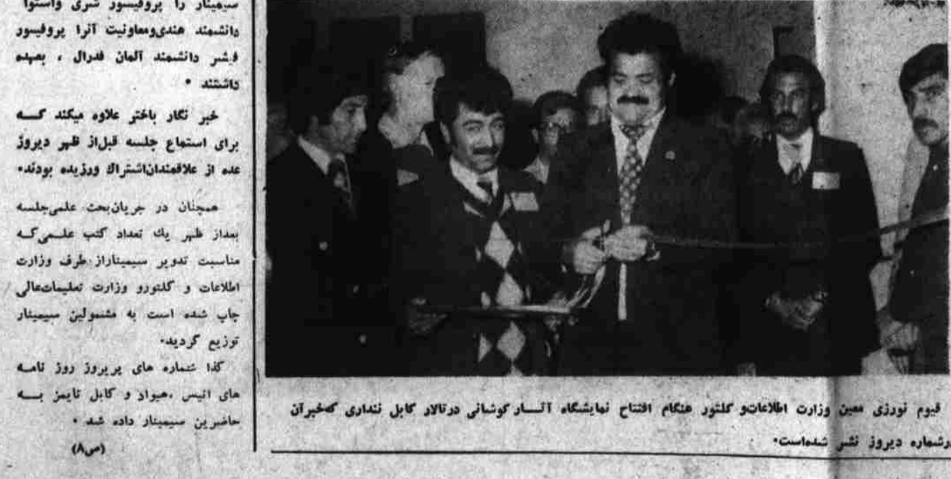
قیوم نوزدی مین وزارت اطلاعات و کلتور هنگام افتتاح نمایشگاه آثار کوشانی در تالار کابل ننداری کبیران در شماره دیروز نشر شده است.

در جلسات علمی دیروز سیمینار بین المللی مطالعات کوشانی علمی از دانشمندان و محققین با ایراد مقالات برجوانب مختلف تمدن کوشانی ها روشنی افتادند.