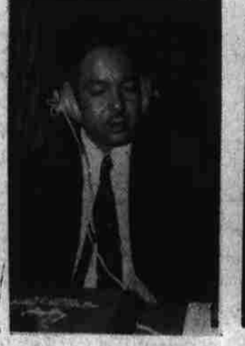
پروفیسور ماری زیوته دی