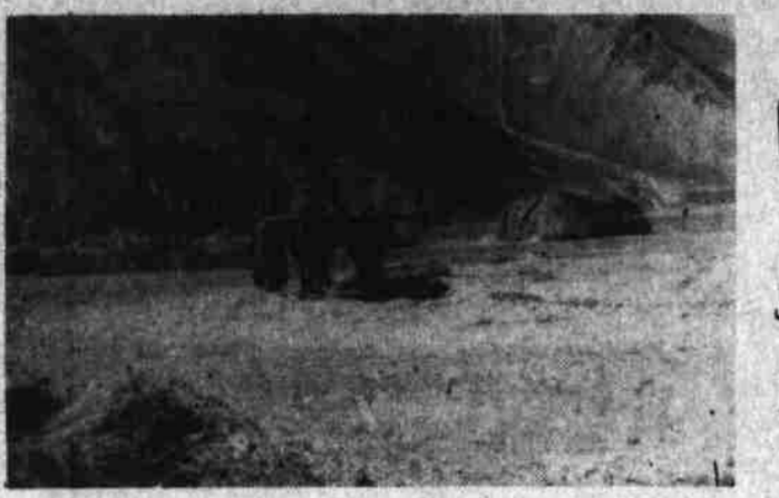
بمادین نتیجه زحمت خود را بصرف خود میرسانیم.

خلق افغانستان به رهبری فرزند برومند و صدیق وطن نورمحمد تره کی طرح های شگوهمند و سود مندی به نفع دهقانان و ستمکشان ریختنانه شد و در نتیجه ضربه های مهلک و کشنده می بر سر بیکر نیو دالیزم فرود آمد حزب دموگرا تیک خلق افغانستان بخاطر ی که به نفع دهقانان رنجبر خد منی انجام داده و آنان را از چنگ مناسبات کهن و غیر عادلانه فیودالی نجات بخشیده باشد فرمان شماره ششم را نافذ نمود و مبارزات پیگیر و بسی اما نی را علیه امحای استعمار و بهره کشی در جامعه ما براه انداخت که در نتیجه این مبارزات پیروز و زی نصیب ستمکشان که قدرت فنانا پذیر جامعه ما هستند گردید. در ولسوالی قیصار تعداد فیودالان وار بابان بیشتر از هر ولسوالی و منطقه دیگر فاریاب بود از بابان این منطقه از هیچ گونه ستمگری در حق دهقانان بیچاره و استعمار شده قیصار دریغ نور زید ند