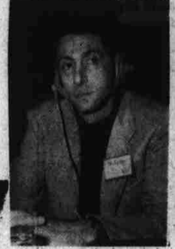
پروفیسور ته دی

دوره حاضر افغانستان دوره ویکتوریا است. اکنون در اینجا سیمینار بین المللی تحقیقات کوشانی و اجلاس دانشمندان و محققان را که دوین سیمینار موجود است احساس برادری می نمایم. این تصمیم آنست که از یک طرف جوانانی که به سر کار آمده اند که خیلی بیادیت، سلسله دوستی و میهن پروری دارند و از طرفی مطالعه میگردم و نمیتوانم