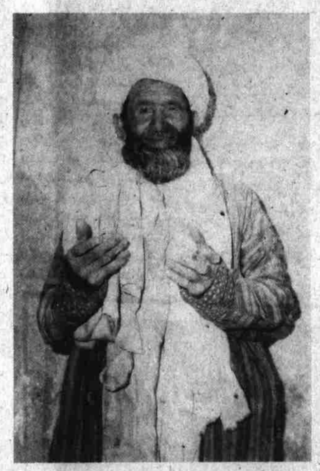
این دهقان میگوید: گذشته از آنکه از نظر جسمی تحت ستم و بهره کشی بودیم از نظر روحی نیز شکنجه می شدیم.

نور یگلسله کشیدگی های سایر زحمتکشان همیشه مورد عمیق طبقاتی بین طبقات ستمگر و ستمکش و لسوالی قیصار موجود بود که در اثر این کشیدگیها دهقانان و