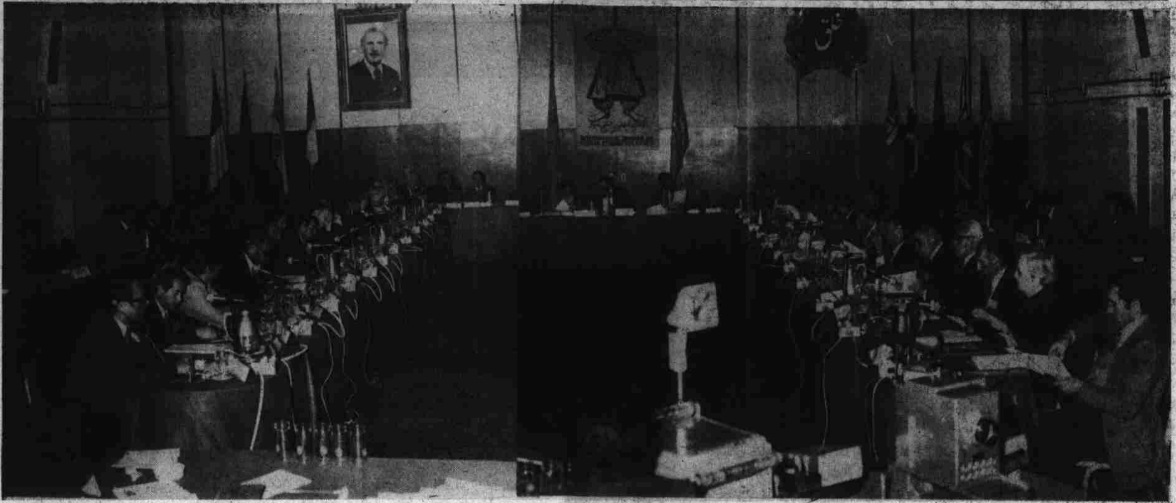
گوشه ای از جلسه سیمینار بین المللی مطالعات کوشانی در هتل انترکانتی ننتال