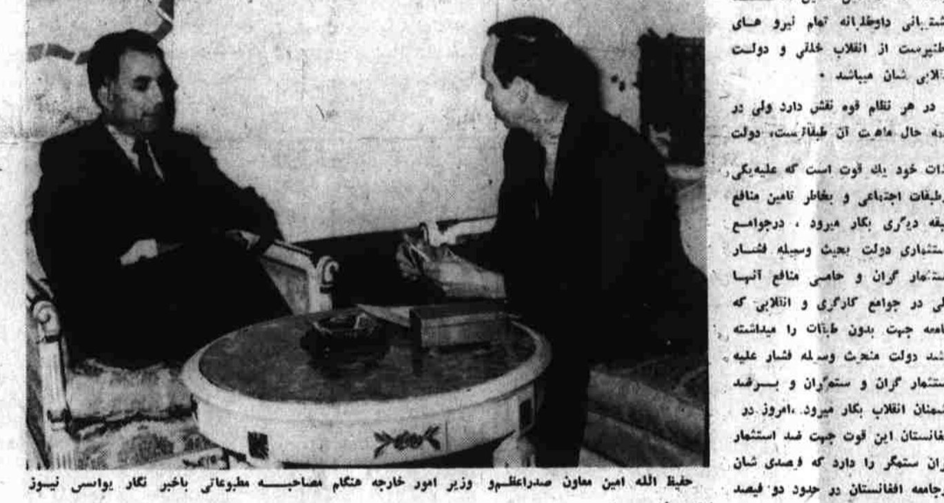
حقیق الله امین معاون صدراعظم و وزیر امور خارجه هنگام مصاحبه مطبوعاتی با خبرنگار تگاری یواسی نیوز ایند ورلد ریپوت.

سوال: آیا در افغانستان آیندهای برای تشیقات خصوصی وجود دارد؟ جواب: مانه تنها به سرمایه داران ملی و متوسط خویش اجازه فعالیت های اقتصادی را میدهم بلکه آنانرا تشویق و حمایت نیز میکنم؟