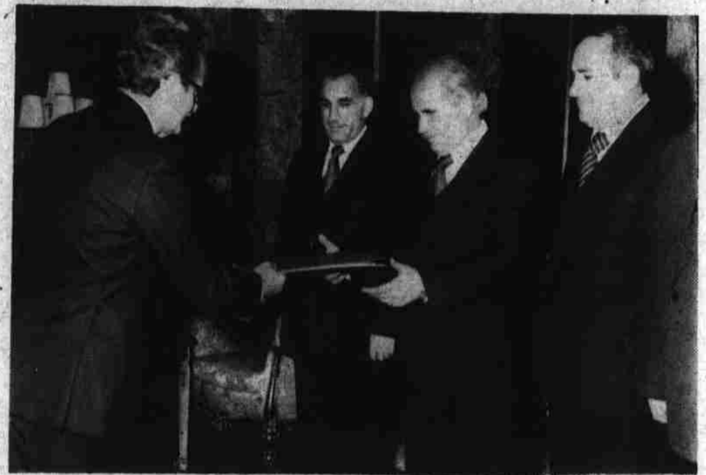
رهبر محبوب و انقلابی ما نورمحمد تره کی رئیس شورای انقلابی و صدراعظم و وزیر امور خارجه اعتماد نامه جلا تسلیم راول...

صدراعظم و وزیر امور خارجه ، فقیر محمد فقیر رئیس دفتر شورای انقلابی و محمد ولی مندوی رئیس تشریفات وزارت امور خارجه نیز حاضر بودند.