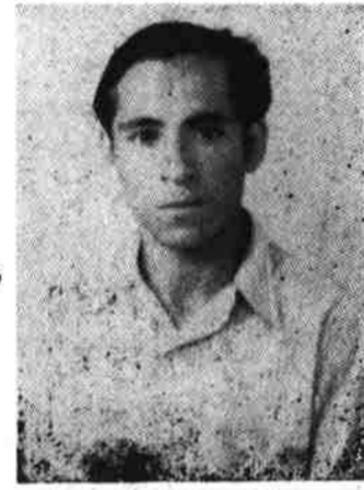
عبدالله دوست خاکساری شاعر تاجیکستان

بیرق گلگون افغان سرفراز سرفراز ، ای همز بان سرفراز انقلاب تور تا ن بایند باد رهروان راه انسان سرفراز بار دیگر زنده شد تاریخ تان با میان و جوز جان سرفراز بلخ تان جاوید و کابل سربلند کارگر این گرده میدان سرفراز حزب پیش آهنگ خلق کارگر تا ابد تا جا ودا نان سرفراز