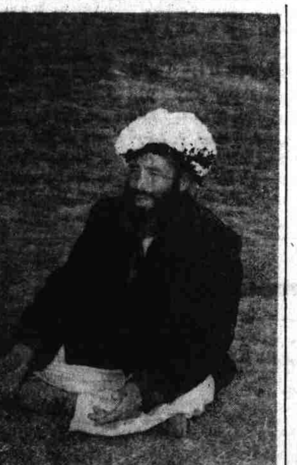
این دهقان میگوید : شکر خدا که از ستم ملاکان خلاص شدیم و یکلقمه نان را با خاطر آرا بخوریم

تعیین نمود است . از نگاه طبی هر گاه زن و شوهر ، آینده دارای این استعداد جسمانی نباشند عواقب خطرناکی را متحمل خواهند گردید . بیماری های جسمی ، عصبی و بعضا روانی از آن بو جود می آید زنیکه هنوز حامل این استعداد جسمانی نیست و قبل از بدست آوردن آن باتوجه به سن معینه قانونی شماره هفتم واقع گردید عبارت از محدود ساختن سن ازدواج است برای دختر و پسر . از نگاه حقوق معاصر اهلیت ازدواج وقتی کامل میگردد که دختر و پسر سن معینه قانونی را تکمیل نموده باشند . سنی که بر اساس آن افراد قابلیت صحی برای ازدواج را پیدا می نمایند به اعتبار طبیعت در هر یک متفاوت است یعنی