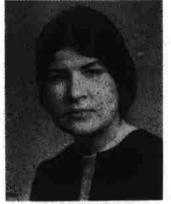
گلرخسار شاعره تاجیکستان

کشور ماست تباری آموختن و فراگرفتن ایدئالوژی دوران ساز طبقه کارگر و قبول شده علمی بایک جهان بینی کامل در پیرامون حزب دموکراتیک خلق افغانستان که در طول سیزده سال بطور خلل ناپذیر به نفع خلقهای ستمکش مبارزات انقلابی و اصولی نموده جمع شوند و ایدئالوژی سازنده جهان نوین طبقه کارگر را خوب بیاموزند و با ایمان داری کامل و روحیه خلاق و انقلابی برای کار و ابتکار آماده گردند . جوانان واقعی ما اگر واقعا به ایدئالوژی دوران ساز طبقه کارگر مجهز و آراسته گردند و در یک حلقه گرد هم جمع شوند به چنان قوت شکست ناپذیر مبدل میشوند که قادر خواهند شد شعار افتخار آمیز (خانه ، نان و لباس) برای همه را که شعار حکومت دموکراتیک و خلقی ماست بزود ترین کشور ماست تباری آموختن و فراگرفتن ایدئالوژی دوران ساز طبقه کارگر و قبول شده علمی بایک جهان بینی کامل در پیرامون حزب دموکراتیک خلق افغانستان که در طول سیزده سال بطور خلل ناپذیر به نفع خلقهای ستمکش مبارزات انقلابی و اصولی نموده جمع شوند و ایدئالوژی سازنده جهان نوین طبقه کارگر را خوب بیاموزند و با ایمان داری کامل و روحیه خلاق و انقلابی برای کار و ابتکار آماده گردند . جوانان واقعی ما اگر واقعا به ایدئالوژی دوران ساز طبقه کارگر مجهز و آراسته گردند و در یک حلقه گرد هم جمع شوند به چنان قوت شکست ناپذیر مبدل میشوند که قادر خواهند شد شعار افتخار آمیز (خانه ، نان و لباس) برای همه را که شعار حکومت دموکراتیک و خلقی ماست بزود ترین