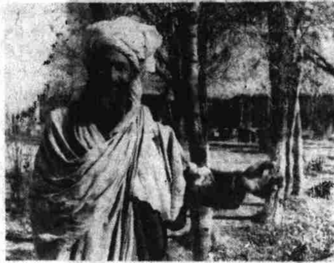
عمر را در خدمت فیودال گذشتانیم اما همانطور که دستم خالی بود تا هنوز خالی ماند