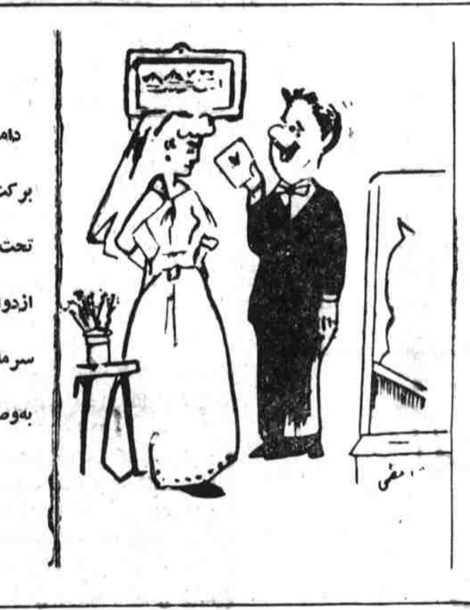
دلماد به عروس: عزیزم هرگاه برکت فرمان شماره هفت نمیبود تحت آن شرایط سنگین و ننگین ازدواج های عصر فیو دالی تا سرما مثل دندان ماسفید میشد به وصال هم نمیرسیدیم!

خلق افغانستان و رهنمود های پیشوای کبیر خلق نور محمد تره کی رئیس شورای انقلابی و صدراعظم بود و قوه پیوسته، نه صرف به شیوه ها و طرز العمل های ضد خلقی گذشته پایداری داد، بلکه در همین مدت گوناگونی امیای استوار و مصیبت و بیسابقه ای در جهت رفاه مادی و معنوی خلق افغانستان و اعمار همه جانبه سر زمین بلا کشیده ما بر داشته است.