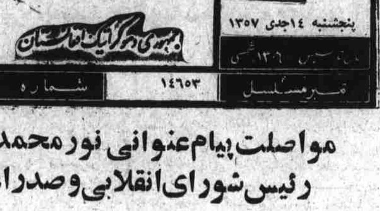
مواصلت پیام عنوانی نورمحمد ترهکی

پوهاند دکتور احسان روستامل معین قنایی وزارت عدلیه با جلاتاب پروژ پیروش سفیر کبیر فرانسه مقیم کابل ساعت یازده قبل از ظهر دیروز در دفتر کارش ملاقات تعارفی بعمل آورد. پوهاند دکتور احسان روستامل معین قنایی وزارت عدلیه با جلاتاب پروژ پیروش سفیر کبیر فرانسه مقیم کابل ساعت یازده قبل از ظهر دیروز در دفتر کارش ملاقات تعارفی بعمل آورد.