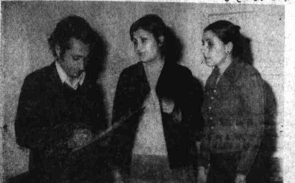
دوربین های گلشنه ضد خلقی هر عمل دوبرایان برای فریب آورده بود ولی امروز هر چیز برای رفاه زحمتکشان و طبقات محروم و ستمکش این جامعه است.