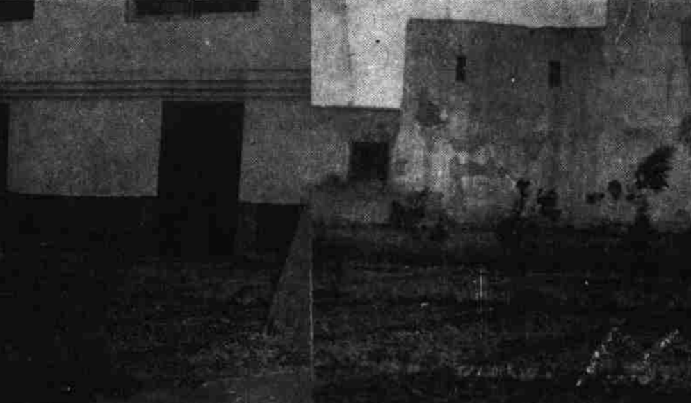
نمای از تپکای قلعه زمانخان

وزارت عدلیه از تمام هموطنانی که درباره این فاجعه تاریخی و مسوولین آن معلومات دارند معترمانه تقاضا دارد تا حقایق و معلومات خود را به منظور کشف حقیقت به خاطر تأمین عدالت و اشنای وسیع مظالم قرون وسطایی رژیم پیدادگر داود از روی ایمان و وجدان در اختیار ما بگذارند تا خود یا خانواده شان ازین حادثه متضرر گردیده باشند نیز به هیات تحقیق اداره عالی خارتوالی مراجعه نمایند. همچنان وزارت عدلیه