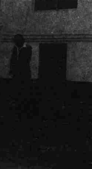
نمای از تپکای قلعه زمانخان

در این مجلسی که ساعت یک و نیم بعد از ظهر آغاز تا حوالي سه و نیم بعد از ظهر ادامه داشت علاوه بر رئیس و اعضای کمیته انسجام ولایت کابل آمران احصائیه مرکزی شپری و دهائسی ولایت کابل نیز حاضر بودند.