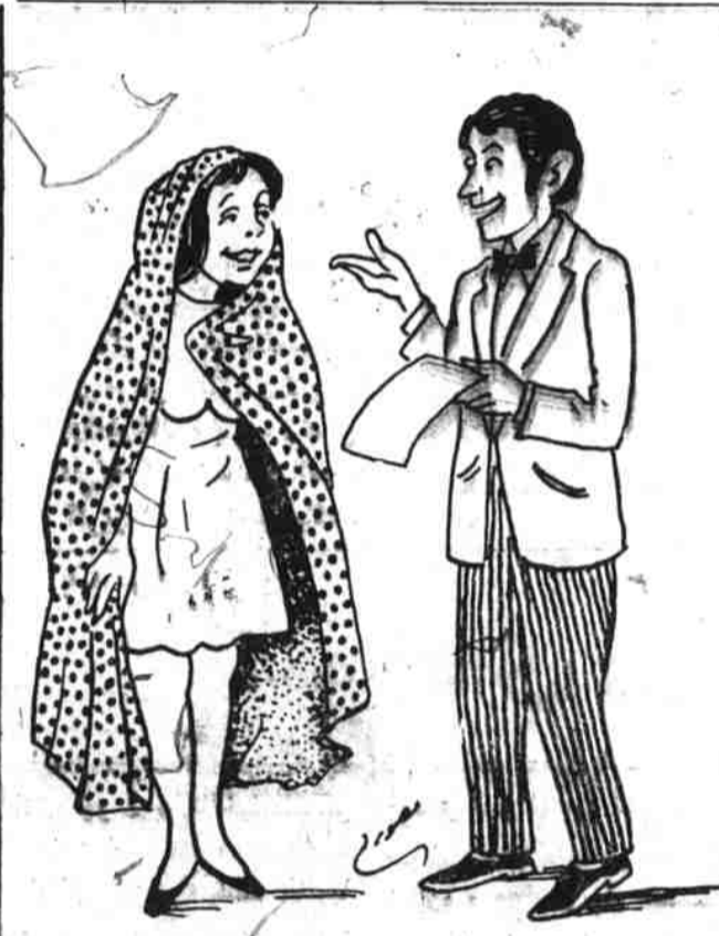
جوان - بعد از انفاذ فرمان شماره هفت بهر امد خود رسيديم حال بكامل خوشي عرو سي ميكنيم.

حفيظ الله امين معاون صدراعظم و وزير امور خارجه درين باره چاره سازي ها را بيان كرد. او از موانع بزرگ درين باره چاره سازي ها را بيان كرد. او از موانع بزرگ درين باره چاره سازي ها را بيان كرد.