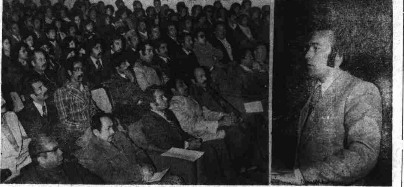
رئیس پوهنتون حقوق هنگام سخنرانی در محفل که بمناسبت چهاردهمین سالگرد مبارزه خلقهای فلسطین بر ضد صهیونیسمی در پوهنتون کابل ترتیب شده بود

چهاردهمین سالگرد مبارزه خلق های فلسطین بر ضد صهیونیسم و امپریالیسم به عذر ظهر دیروز از طرف کمیته حزبی فعالیت های کلتوری پوهنتون کابل با اشتراک محصلین فلسطینی و کشور های عربی در آن پوهنتون تجلیل گردید. در محفلیکه بهمن مناسبت در بود دیپلوم انجیر عزیز الرحمن سمیدی رئیس پوهنتون کابل روسا و عده از محصلان پوهنتون کابل کابل اشتراک و زبیده بودند. محفل بسا سرود ملی جمهوری دموکراتیک افغانستان و سرود ملی خلق فلسطین آغاز گردیده متعاقبات نخستین اعلامه سازمان انقلابی الفتح قرائت گردید. سپس پوهنتوی دکتر یوسفی رئیس پوهنتون حقوق و علوم سیاسی پوهنتون کابل در باره مبارزات پیکر خلق فلسطین بسر ضد صهیونیسم و امپریالیسم مصلحا توضیحات داده گفت جمهوری دموکراتیک افغانستان با حمایت خلقی با ماضی ضد امپریالیستی و ضد فئودالی در ساحه بین المللی از مبارزات خلق فلسطین و مبارزات آزادی بخش ملی خلق های جهان حمایت صادقانه مینماید و بطور لاینقطع طرفدار وحدت تمامی نیروهای انقلابی جهان به اساس انتر ناسیو نالیزم پروتاری است. انقلاب کبیر و نظریه تود تجلیل و برگزاری میدارند. رئیس پوهنتون حقوق و علوم سیاسی پوهنتون کابل در باره مبارزات پیکر خلق فلسطین بسر ضد صهیونیسم و امپریالیسم مصلحا توضیحات داده گفت جمهوری دموکراتیک افغانستان با حمایت خلقی با ماضی ضد امپریالیستی و ضد فئودالی در ساحه بین المللی از مبارزات خلق فلسطین و مبارزات آزادی بخش ملی خلق های جهان حمایت صادقانه مینماید و بطور لاینقطع طرفدار وحدت تمامی نیروهای انقلابی جهان به اساس انتر ناسیو نالیزم پروتاری است.