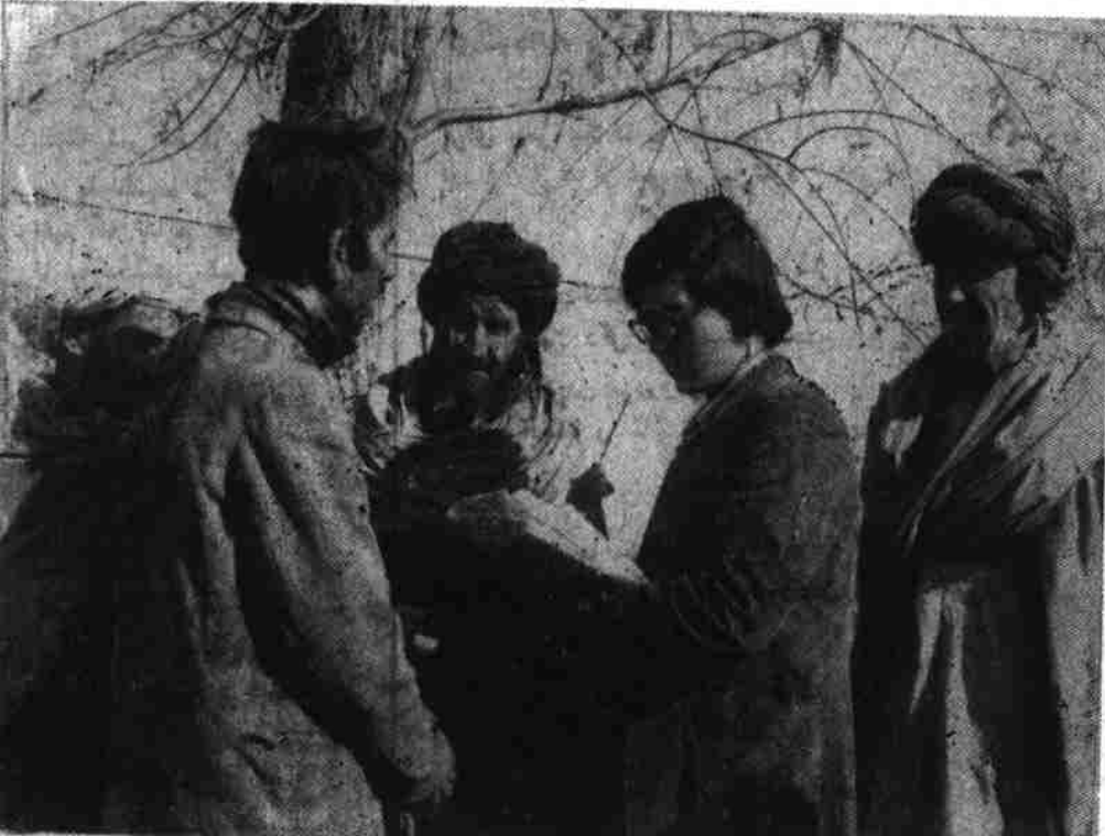
دهقانان، درباره فرمان شماره هشت نظر میدهند

و دولت جمهوری در دموکراسی افغانستان بدون هراس از این سنگ اندازی های ارتجاعی فعالیت های خلقی خویش ادامه داد. رهایی هزاران زندانی از زندان های شوم قرون وسطایی خاندان نادری، انفاذ فرمان چارم و پنجم کام های استواری بود تا موقع ضربه به فیو دالیزم میسر گردد و بپیکر فیو دالیزم وارد آمد و این ضربه فرمان شماره ششم برد، گلیب فر سوود سود و سلم و گروی چیده شد و پزده میلیون دهقان زحمت کش که زیر بار سنگین سود و سلم و گروی زندگی مشقت باری داشتند از بار این ستم آشکار با این ضربه فیو دال گنج شد بازه های قدر نفس مست گردید. متعاقب آن فرمان شماره هفتم بینه مناسبات پدرسالاری در افغان نستان خاتمه بخشید. با انفاذ این فرمان حقوق زنان و