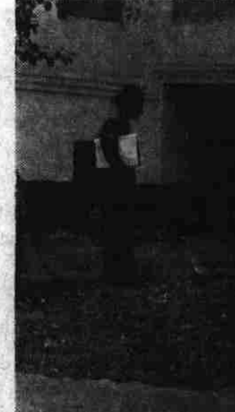
محل اجساد دفن شده در صحن قلعه زمانخان پخیر نگارانیس نشان داده میشود.