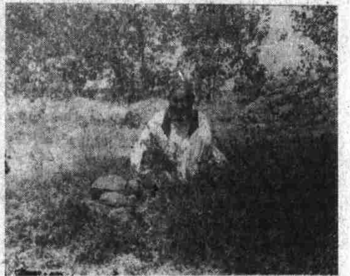
دهقان ستمکش میگوید :

این فرمان زمین های دهقانان را از قید ، سود ، سلام و گروی خلاص کرده است . کمیته حل مشکلات دهقانان و لسوالی چهاردهمی به منظور تطبیق درست و قانونی فرمان شماره ۶ به کمیته های فرعی مشکلات دهقانان و لسوالی چهاردهمی تقسیم کرده است که به دهقانان بفهمانند که