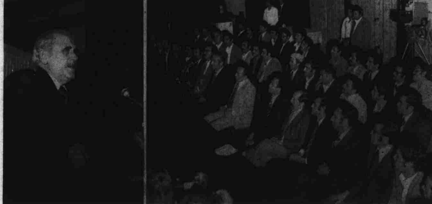
هنگامیکه رهبر کبير انقلابی مارلیک نور محمد ترمه کی منشی عمومی کمیته مرکزی حزب دموکراتیک خلق افغانستان رئیس شورای انقلابی و صدراعظم با منشی های کمیته های حزبی نواحی مرکز و ولایات کشور صحبت می نمایند.