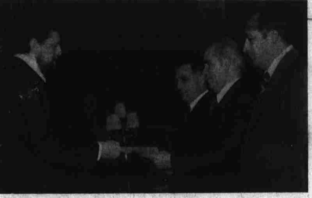
رفیق نور محمد ترمه کی رئیس شورای انقلابی و صدراعظم اعتماد نامه سفیر کبیر در کابل را می پذیرند.