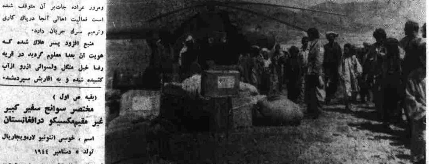
ارسال مواد امدادی سره میاشت به آسیب رسیدگان سیلابهای اخیر

در اثر باریدن باران های شدید پیروز ۲۹ - اسد سوزا زیر شدن سیلاب پیروزه سربند نهر گجر و کلاک علائقهای میزبان ولایت زابل خساره مند گردیده است. یک منبع مدیریت انکشاف دهات آن ولایت گفت که در اثر این سیلاب ها دو پایه و تزییب، مفاد پنج خریطه ستمت و یک تماد ابراز ساختمانی از بین رفته است. همچنان دیوار این سی بندگه اخیراً تکمیل شده بود تخریب و سیلونی پروژه متذکره شدیداً متضرر گردیده است. قراریک خبر دیگر به اثر سیلاب