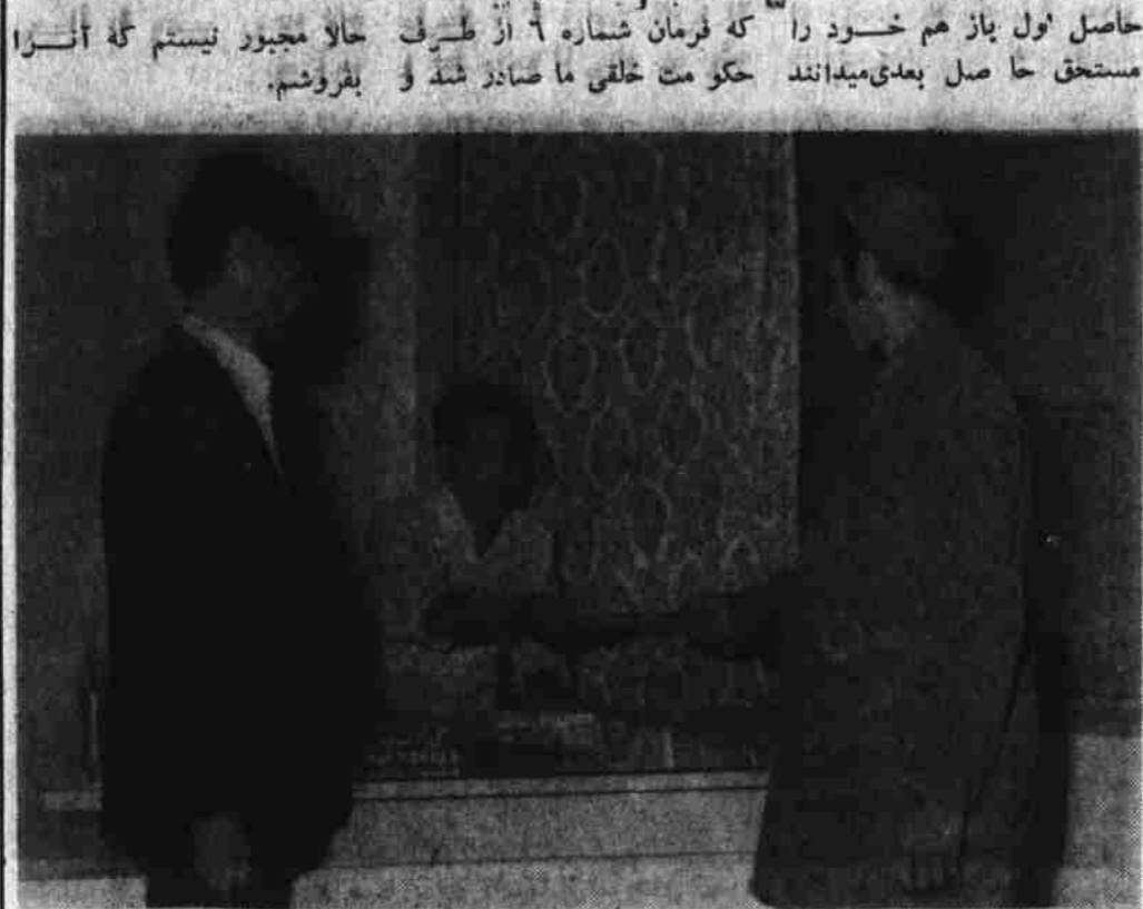
یکی از دهقانان ولسوالی چهاردهمی عریضه اشرا به رئیس کمیته حل مشکلات دهقانان می دهد .

با انفاذ فرمان شماره شش ماتم های جمعی دهقانان کم زمین برداشته شده است دهقانان ما باید به جرات به کمیته های حل مشکلات دهقانی مراجعه نمایند