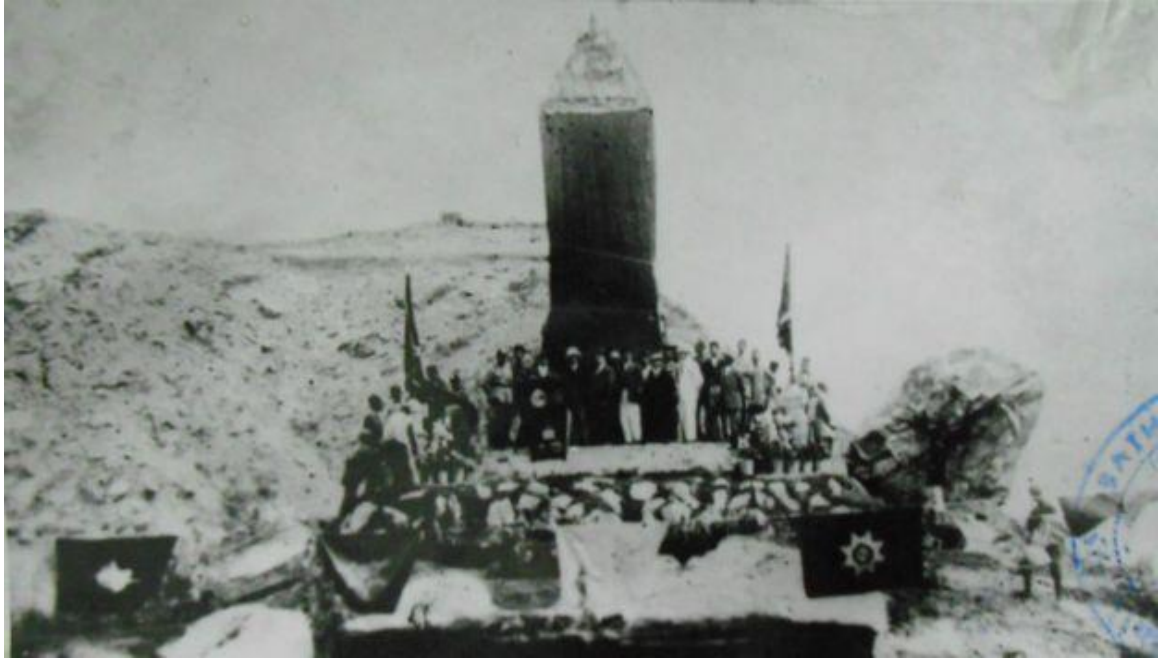
د علم او جهل څلی د پرانیستو په ورځ