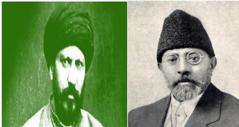
علامه سيد جمال الدين افغان او محمود طرزي (د افغانستان د مطبوعاتو پلار) اود استعمار او استبداد نامتو مبارزين

د لومړي مشروطيت سرسپارليو، خپل وطن، استقلال، عقيدې او افغانيت ته متعهدو ننګيالو د امير عبدالرحمن خان دخونري قهر او ساتور لاندې د آزادۍ او خپلواکۍ زمزمه توده کړه، خو استبداد او ښکيلاک دوی يو يو او ډله ييز له منځه يووړل، خو د خپلواکۍ غوښتلو غورځنگ او وينه نوره هم په جوش او خروش شوه، دا ځل د مشروطيت او استقلال دوهم غورځنگ راپورته شو. د مشروطيت د دويم غورځنگ غړيو سيده د مشروطيت دلومړي غورځنگ له قربانيو او په ناسيده توگه د افغانۍ سيد له شاگرد محمود طرزي څخه الهام اخيست.