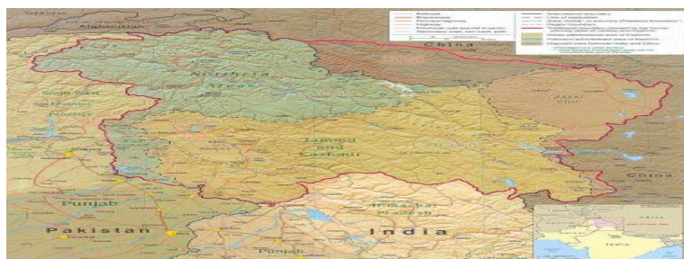
جامو و کشمیر

اکثریت مردم جامو و کشمیر مسلمان است. از آنجا که سرچشمه های منبع آب اصلی پاکستان در سیستم رودخانه ایندوس ، در کوهستان های J&K واقع شده است از اهمیت استراتژیک برخوردار است. وناسیونا لیست پاکستانی معتقد اند ویا که میخواهند که آن ساحه باید بخشی از ایالت آنها باشد.