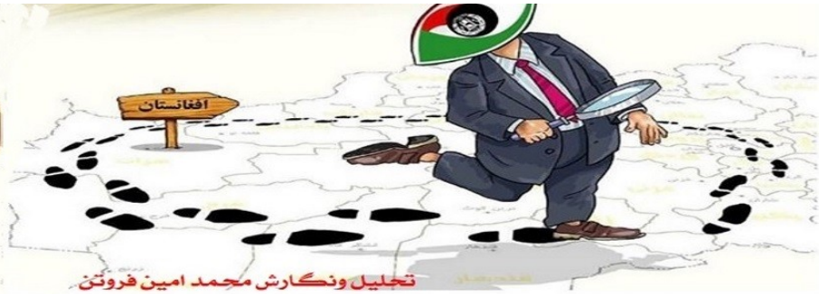
تحلیل و نگارش محمد امین فروتن