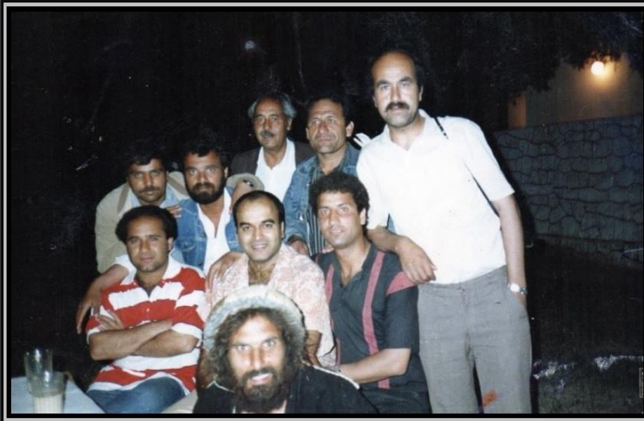
محترم صبور سرباز در جریان فلمبرداری فلم ہندی