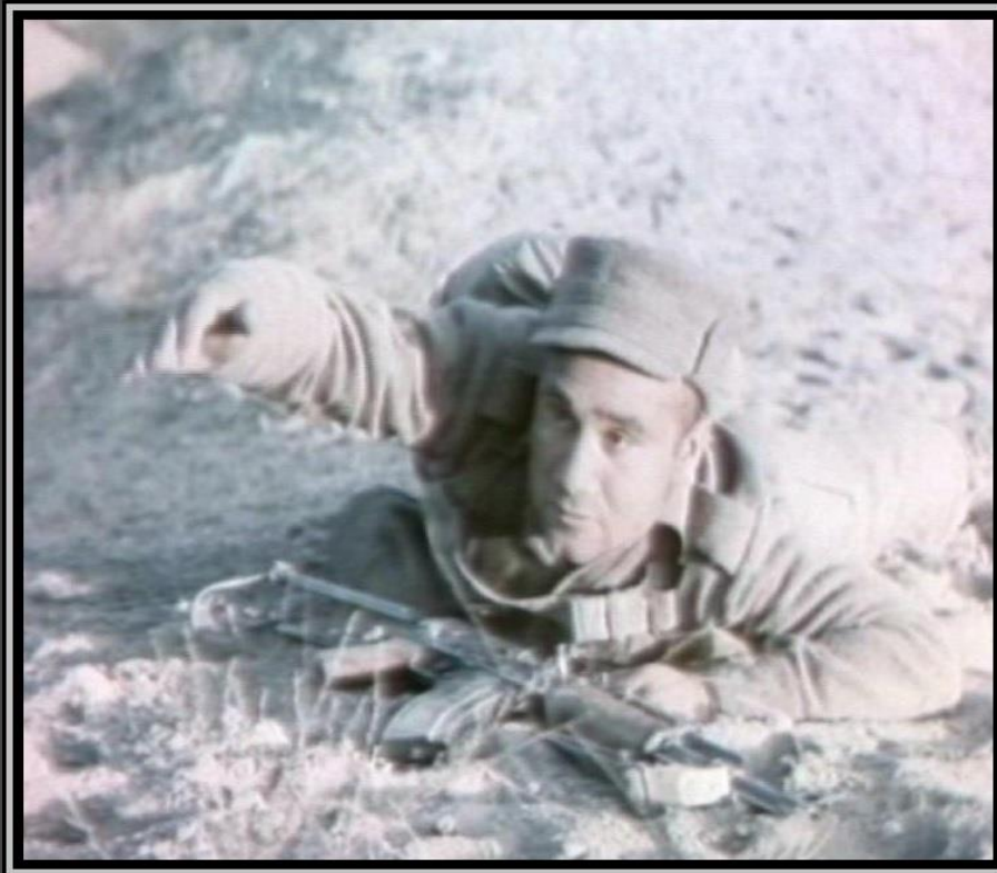
محترم صبور سرباز در جريان فلمبرداری فلم صبور سرباز

بودند، و من با درك درست از واقعيت هاي جامعه ، كوشش و تلاشم ، توانستم اين شخصيت فلم را انطوريكه لازم بود بازي كنم ، كه خيلي مورد توجه حكومت و مخصوصا مردم قرار گرفت.