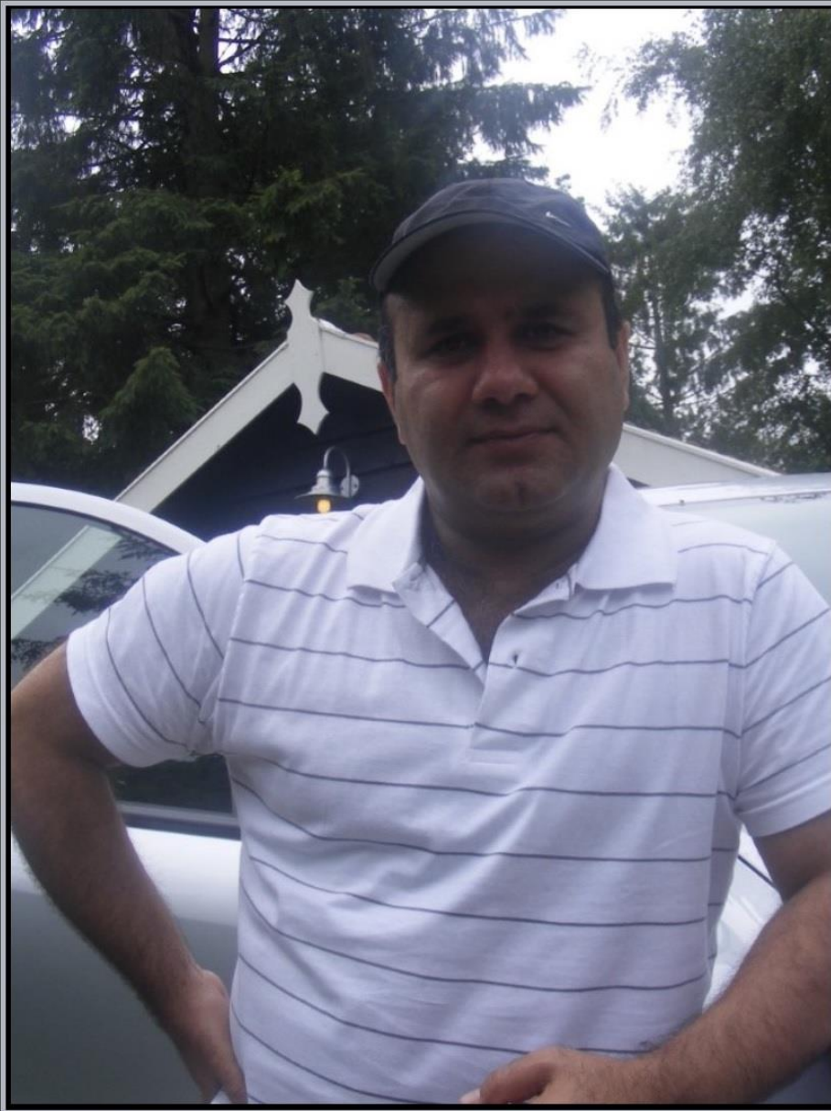
محترم صبور سرباز سینماگر ورزیده کشور ما