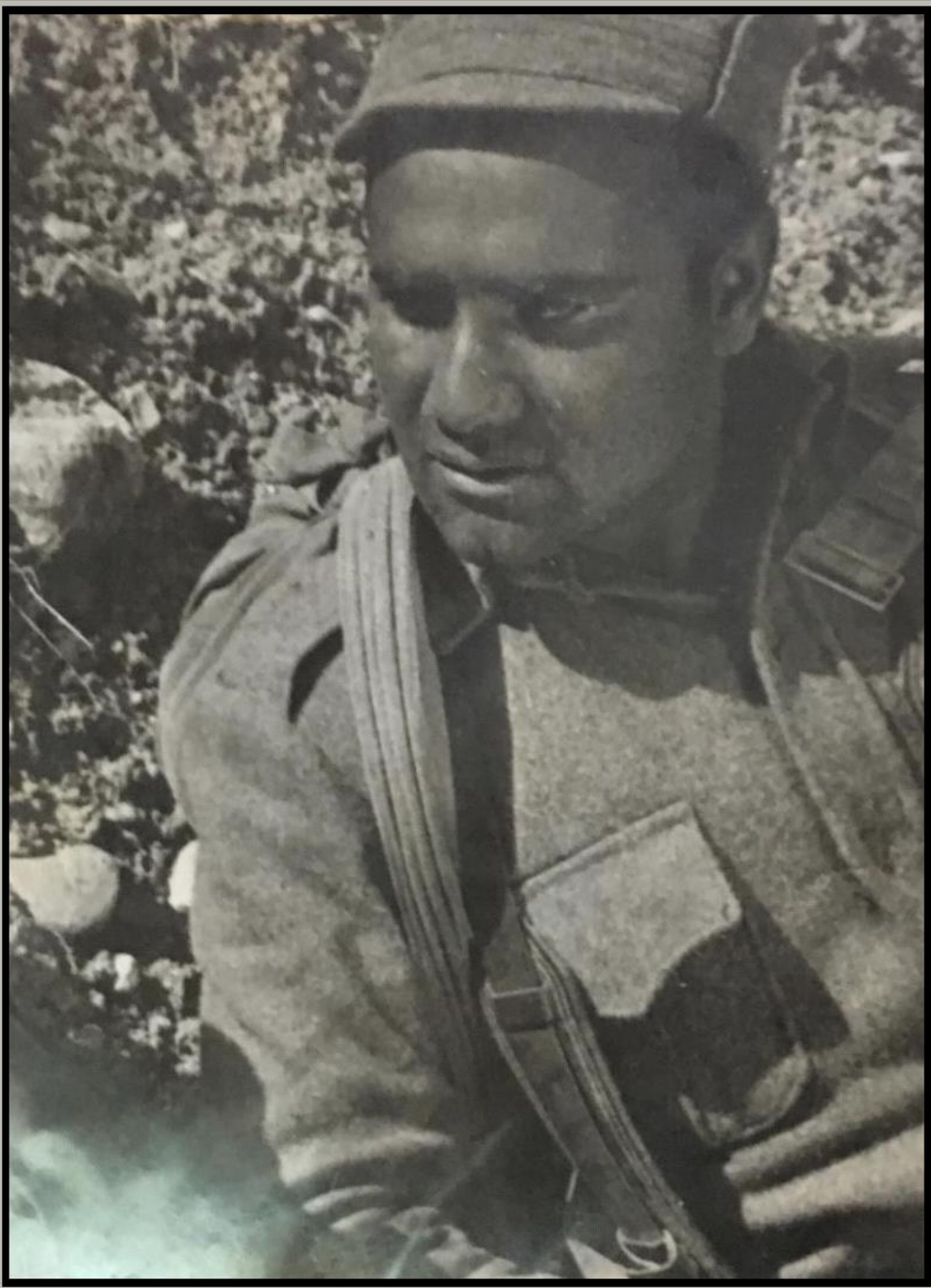
محترم صبور سرباز در جریان فلمبرداری فلم صبور سرباز

پرسش : تعدادی از سینما گران کشور ما بنابر دلایلی گوناگون از جمله عدم موجودیت آزادی بیان و مردمی در ساختن فلم های خود محافظه کارانه عمل مینمایند. مگر برخی از فلم سازان ما بی باکانه و هدفمند در ساختن بعضی از فلم ها از سوژه های اجتماعی داغ روز استفاده