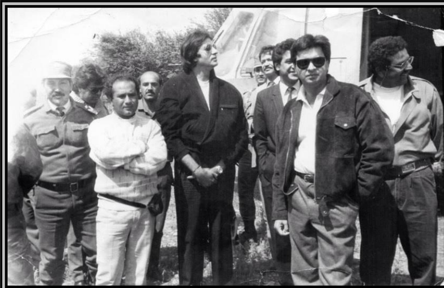
محترم صبور سرباز در جریان فلمبرداری

پاسخ : دقیقا سینما بالیود یک سینما سر گرم کننده است ولی در کنار آن سینما هالیود ضمن که سر گرم کننده است سینما با مفهوم و به یک نوع مطابق پالیسی کل کشور شان است. فلمهای مطرح و با معنا را باید چند بار دید تا بدانیم که چه هدف را کارگردان یا نویسنده دنبال میکند ولی فلم های سر گرم کننده هندی در آغاز صحنه هایش می توان تمام داستان را فهمید. دلیل دیگری نزدیکی فرهنگی ماست رسم و رواج و حتی عقائد ، هندوستان سه برابر کشور ما مسلمان دارند که ما از این لحاظ نیز نزدیکی داریم ، همچنان شرایط زنده گی دهات و قصبات مردم هند چندان با مردم ما تفاوت ندارد، چه از نظر پوشی لباس چه از نظر کار و کشاورزی و کار های زنان در روستا ها ، و ده ها رابطه فرهنگی دیگری؛