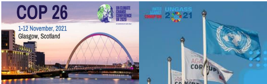
پورتني دوه نړیوالی غونډې د دوام لرونکی پرمختیا او د هغې د اهدافو په اړه دي

د اقلیمی بدلون ستونزی عامل پرمختللو صنعتی هیوادو کی دی، له بده مرغه یو شمیر هیوادونو دی مسئلی ته اهمیت ورنکړ، مثلاً د امریکې متحده ایالاتو د دونالد ترامپ پرمهال په څرگند ډول د پاریس د اقلیمی کنفرانس له پریکړو سرغړونه وکړه. د پاریس کنفرانس د اقلیمی مسایلو په اړه ډیرې بنې پریکړې کړې وې، بل ځل په دی مقصد څه موده وړاندې د سکاټلند د گلاسکو په ښارکې د اقلیمی مسایلو په هکله د (COP 26) کنفرانس دایر شو، همدارنگه نړیوال مجبور شول چې دا ځل په ډیره لوږه کچه؛ یعنی د م.م. په عمومی اسمبله کی دا موضوع مطرح کړي. د اقتصاد او ساینسی نورو څانگو پوهانو د هیوادو لپاره پرمختیا داسې وښوده: