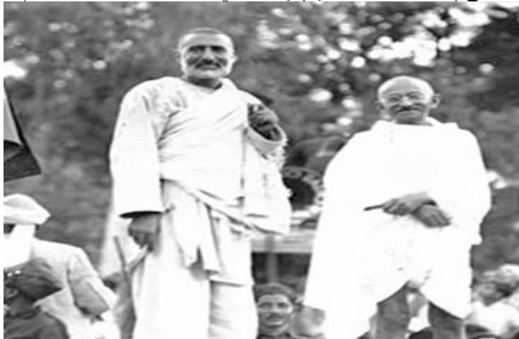
انځور: پاچا خان د مهاتما گاندي سره انځور شوی (c. 1940s) د عامه ډومين لاندې جواز لري)

د پاچا خان سره چلند د انگریزي استعمار د وحشت يوه ستره بيلگه وه چې په افغاني ټولنه کې يې داسې نښه پرېښوده چې تر نن ورځې پورې پاتې ده. خو لکه څنگه چې سروتي بالا په گوته کوي، پرته له دې چې د پښتنو د تاريخ دغه اړخونه په پام کې ونيول شي، دا اسانه ده چې د پښتنو کلتور ته د تعصب په توگه د هغه ختيځ په توگه وگورو چې په داخلي توگه د وحشت او انتقام ارزښت لري.