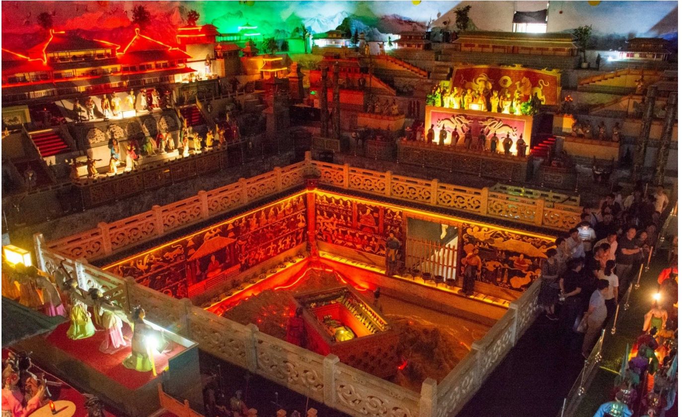
مقبره کین شی هوانگ

میلاد آغاز شد، زمانی که او هنوز ۱۳ سال داشت، اگرچه ساخت و ساز کامل آن تنها بین فتح شش ایالت بزرگ دیگر و متحد کردن چین در سال ۲۲۱ قبل از میلاد آغاز شد. در سال ۲۲۱ قبل از میلاد، حدود ۳۹ سال پس از شروع کار، تکمیل شد. جغرافیای کوه لی به دلیل زمین‌شناسی فرخنده اش به عنوان محل دفن امپراتور انتخاب شده است: "معروف به معادن سنگ سبز و سمت شمالی آن سرشار از معادن طلا بود."