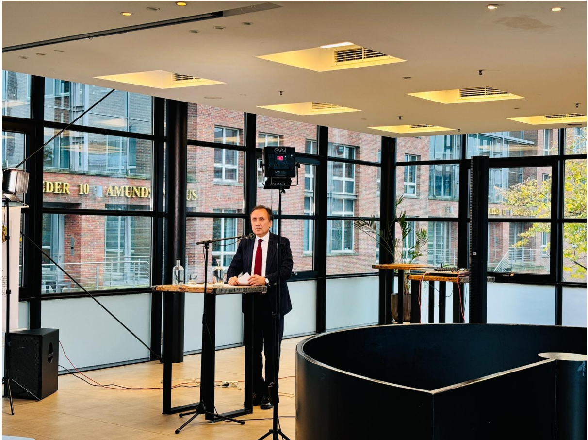
دکتر امام الدین ستاروف ، سفیر کبیر جمهوری تاجیکستان در برلین