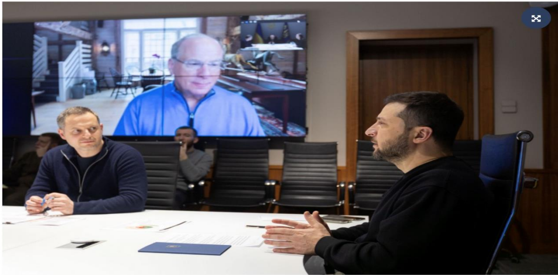
President of Ukraine Volodymyr Zelenskyy held a video conference meeting with Larry Fink, CEO of one of the world's leading investment managers, BlackRock.