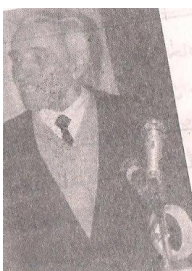
پروفیسور حقنظر «نظروف»

«اگر افغانستان چنین کردها داشته باشد، به دعوت مشاوران از مملکت های دیگر چه حاجت است؟» ... او تاریخ خلق خود، تاریخ جهان بشریت، زبان و ادبیات را بصورت عالی میدانست. از فلسفه شرق و غرب، خوب آگاه بود، شعر هم می نوشت. طاهر بدخشی در دو سمت مبارزه می برد: در سمت متحد نمودن اشخاص پیشقدم جامعه و عموماً زحمتکشان افغانستان علیه ملت چیان شئون نیست که منفعت یک گروه خاص را بر منافع عامه رجحان می بخشیدند. وقتی که خواننده مقاله های سیاسی، تحلیلی و علمی او را می خواند، انگشت حیرت می گزد که در شرایط دشوار و استبداد ملی چگونه با جسارت مقاله های زیاد درسی و علمی می نوشت و اثبات می نمود که خلاف تبلیغات ملیت گرایان حاکم، خلق تاجیک، اوزبک، ترکمن، پشتون و غیره مردم بومی سکنه اصلی این سرزمین اند. زیرا در افغانستان بر وفق مقوله ها و ضرب المثل های مردمی به شیوه «دزد زور صاحب گاو را بسته است» عمل میکنند. در نوشته های طاهر جان غیر از حق و حقانیت و حقوق انسان چیزی دیگری مطرح نمیشد. ولی همین حقیقت به چشم ملیت گرایان و تنگ نظران چون خارمغیلان می خلد. این است که طاهر جان را بار ها تعقیب کردند، به حبس گرفتند و شکنجه دادند. طاهر بدخشی، طبقه حاکم مخصوصاً همه آنها را که خود را مدافع حقوق نجات بخش خلق حساب میکردند، خوب می شناخت ...»