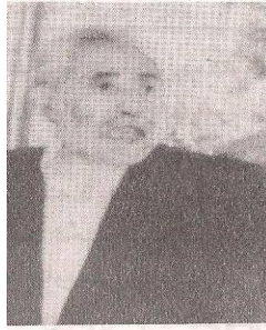
قاضی عزیزالرحمن «ممنون»

دهم: عقیده ما دایر به این مسئله که استاد بدخشی دانشمند و نظریه پرداز ملت شناس است و به این واقعیت تکیه دارد که اکثر آثار باقیمانده او به مسئله های ملی و وطن دوستی بخشیده شده اند...»