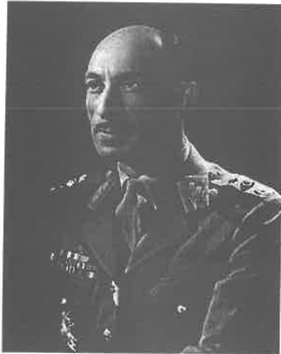
محمد ظاهر شاه