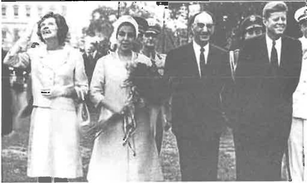
اعلیحضرت محمدظاهرشاه و ملکه حمیرا حین سفر به امریکا با جان اف کنیدی رئیس جمهور و خواهرش ۲ اسنایمر ۱۰-۱۹۶۳ سنبله ۱۳۴۲