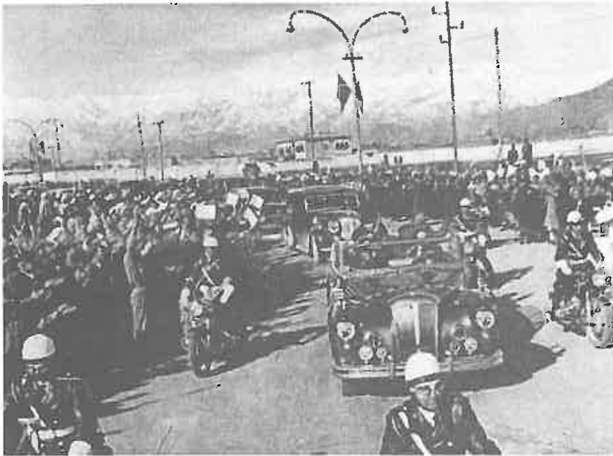
استقبال شهریان کابل از جنرال آیزن هاور رئیس جمهور امریکا هنگام سفر به افغانستان (۹ دسامبر ۱۹۵۹) ۱۷ قوس ۱۳۳۸ .