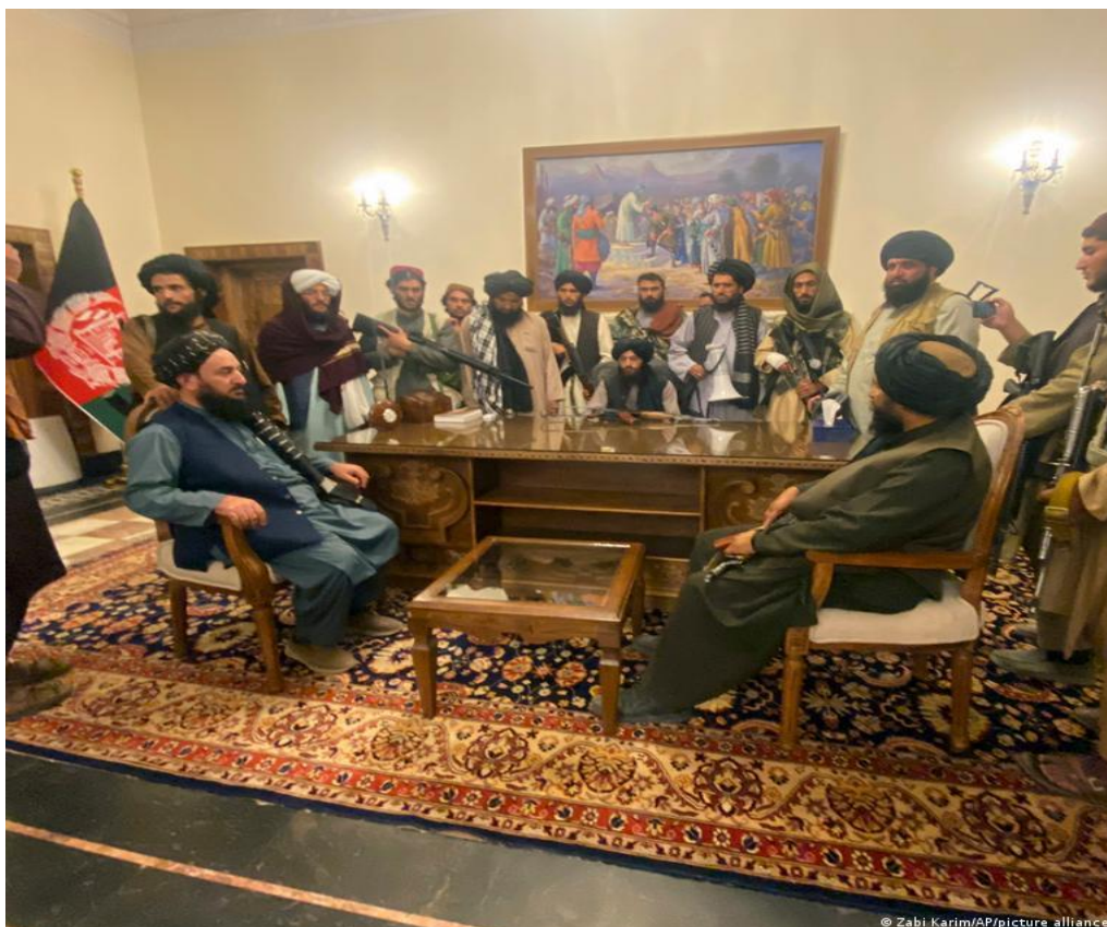
طالبان در قصر گلخانه ریاست جمهوری